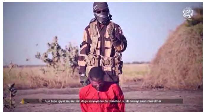
תיעוד ההוצאה להורג (טלגרם, 6 באפריל 2022).