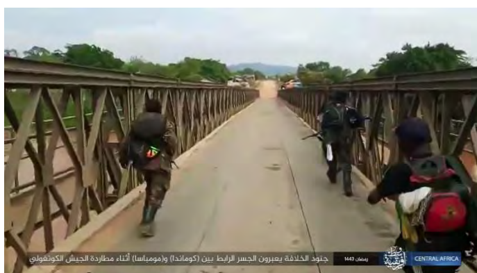
פעילי דאעש במרדף אחר חיילי צבא קונגו (טלגרם, 11 באפריל 2022).

◀ במהלך השבוע תקפו פעילי מחוז מרכז אפריקה של דאעש מספר עיירות נוצריות. מספר אזרחים נהרגו ורכוש רב הועלה באש (על פי דיווחי דאעש, טלגרם):