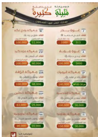
האינפוגרף המפרט את הקרבות (אלנבא', טלגרם, 6 באפריל 2022)