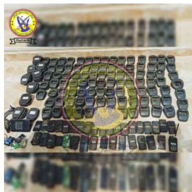
חלק מהציוד שאותר.