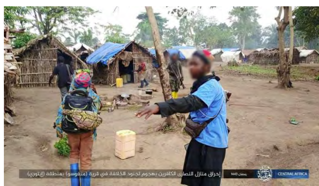
פעילי דאעש פועלים באחת העיירות הנוצריות (טלגרם, 11 באפריל 2022).