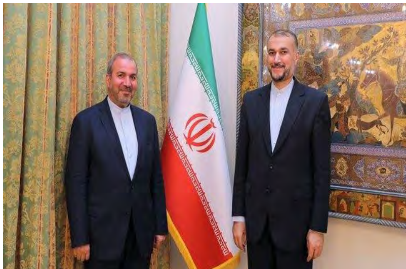
פגישת שגריר איראן החדש בבגדאד עם שר החוץ האיראני (איסנ"א, 8 במאי 2022)

◀ נשיא איראן, אבראהים ראיסי, שוחח ב-5 במאי 2022 בטלפון עם ראש ממשלת עיראק, מצטפא כאט'מי, לרגל עיד אלפטר. ראיסי הדגיש את תמיכת איראן באחדותה של עיראק והביע תקווה לכינונה בקרוב של ממשלה חדשה בעיראק (תסנים, 5 במאי 2022). ◀ שגרירה החדש של איראן בעיראק, מחמד כאט'ם אל-י צאדק (Mohammad Kazem Al-e Sadegh), נפגש ב-7 במאי 2022 עם שר החוץ האיראני, חסין-אמיר עבדאללהיאן, לקראת תחילת שליחותו כשגריר (איסנ"א, 8 במאי 2022). אל-י צאדק מחליף בתפקיד את אירג' מסג'די (Iraj Masjedi), ששימש שגריר בבגדאד מאז אפריל 2017. השגריר החדש, יליד נג'ף שבעיראק, שימש כסגן השגריר בבגדאד.