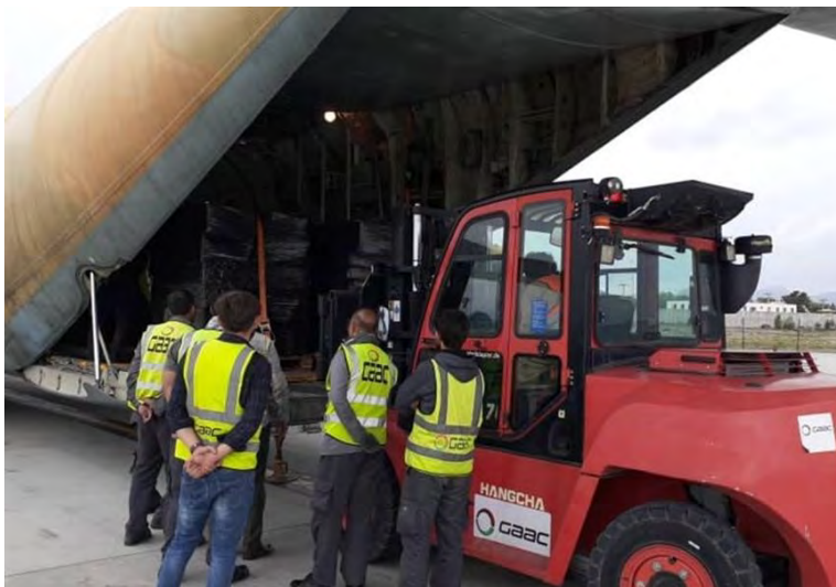
העברת סיוע הומניטרי מאיראן לקאבול (תסנים, 4 במאי 2022)

◀ משלוח הומניטרי איראני נוסף עבור אזרחי אפגניסטאן הגיע ב-4 במאי לקאבול. המשלוח כלל מזון ותרופות. שבוע קודם לכן העבירה איראן לעיר מזאר-י שריף משלוח, שכלל 11 טון של מזון ובגדים. לדברי הקונסול האיראני במזאר-י שריף, סיד חסן יחיי (Seyyed Hassan Yahyavi), המשלוח נועד לחלוקה בקרב משפחות ההרוגים והפצועים בפיגועי הטרור, שבוצעו במהלך החודש האחרון בעיר. בנוסף על כך, העביר הקונסול למשפחות נפגעי הפיגועים האחרונים גם סיוע כספי (תסנים, 4 במאי 2022).