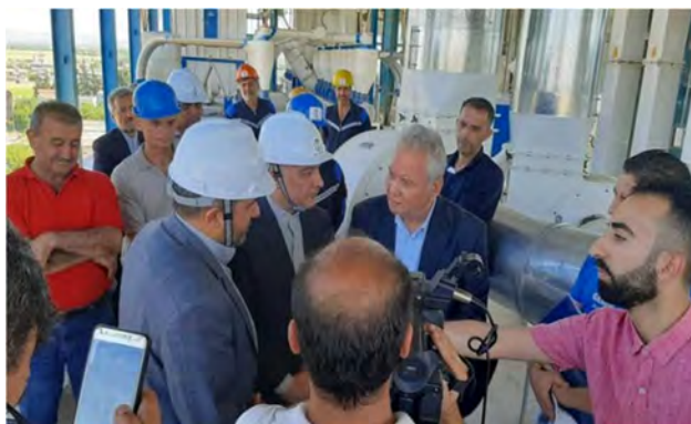
ביקור שגריר איראן בדמשק במפעל קמח הנבנה על ידי חברה איראנית (איסנ"א, 29 במאי 2022).