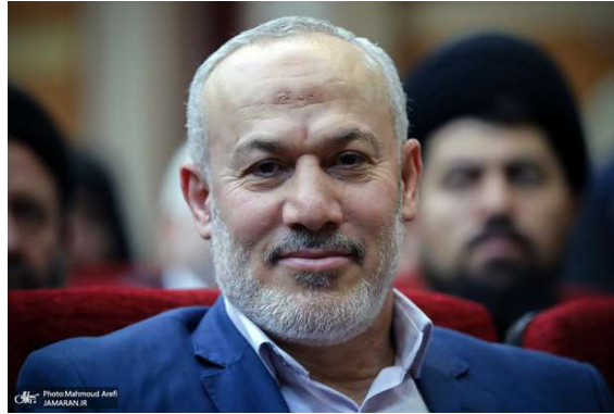
נציג הג'האד האסלאמי הפלסטיני בטהראן (ג'מאראן, 2 ביוני 2022).