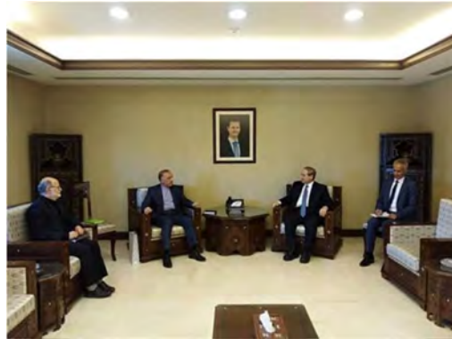
פגישת שר החוץ הסורי עם שגריר איראן בדמשק (אילנ"א, 26 במאי 2022).

◀ שגריר איראן בדמשק, מהדי סבחאני (Mehdi Sobhani), נפגש ב-26 במאי עם שר החוץ הסורי, פיצל מקדאד (Faisal Mekdad). בפגישה דנו השניים בהתפתחויות בזירות האזורית והבינלאומית ובשיתוף הפעולה בין שתי המדינות (אילנ"א, 26 במאי 2022).