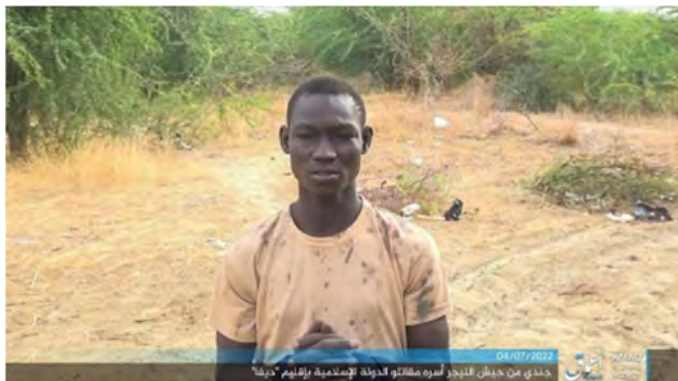
החייל החטוף כפי שצולם על-ידי פעילי דאעש (טלגרם, 4 ביולי 2022)

כוחות הביטחון של ניז'ר סיכלו ב-3 ביולי 2022 תקיפה של פעילי בוקו חראם נגד מחסום של המשמר הלאומי בעיירה גארין דוגו (Garin Dogo), בדרום-מזרח המדינה. 11 פעילי הארגון נהרגו. באירוע נהרג גם חייל (סוכנות הידיעות הצרפתית, 5 ביולי 2022).