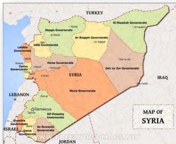
מפת מחוזות סוריה (Free world maps)