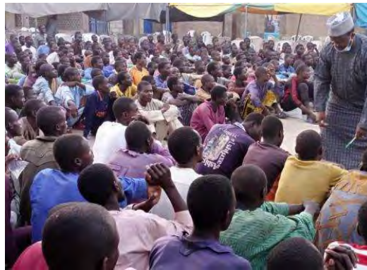
הפעילים שהסגירו עצמם לידי כוחות הביטחון הניגריים (דף הפייסבוק של צבא ניגריה, 29 ביוני 2022)

◀ 314 פעילי בוקו חראם ומחוז מערב אפריקה של דאעש הסגירו עצמם ב-29 ביוני 2022 לידי כוחות הביטחון הניגריים באזור באמא (Bama) במדינת בורנו, בצפון-מזרח ניגריה (דף הפייסבוק של צבא ניגריה, 29 ביוני 2022).