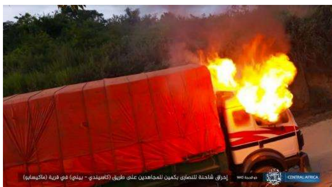
משאית של אזרח נוצרי, שהועלתה באש על-ידי פעילי דאעש (טלגרם, 2 ביולי 2022).