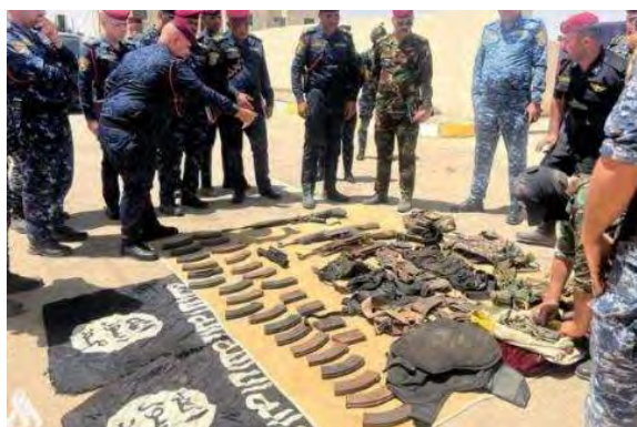
אנשי אמצעי הלחימה שאותרו (סוכנות הידיעות העיראקית, 2 ביולי 2022)

◀ צבא עיראק הודיע ב-2 ביולי 2022 על תפיסת 17 פעילי דאעש ושישים מבוקשים במחוז כרכוכ. כמו כן הושמדו שבעה מוקדי טרור, אותרו שבעה מאגרי אמצעי לחימה ותחמושת ביניהם 24 פגזים, 55 פצצות מרגמה ושמונה רקטות. כמו כן נוטרלו 59 מטעני חבלה ושתי חגורות נפץ (סוכנות הידיעות העיראקית, 2 ביולי 2022).