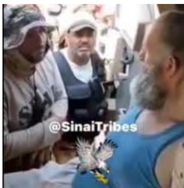
בכיר מחוז סיני של דאעש (לבוש גופיה בצבע תכלת) שנעצר בבא'ר אלעבד (חשבון הטוויטר @mahmouedgamal44, 1 ביולי 2022)

◀ צבא מצרים ואיחוד שבטי סיני עצרו ב-1 ביולי 2022 בצפון חצי האי סיני את מפקד (אמיר) אזור בא'ר אלעבד של מחוז סיני של דאעש, והרגו שניים ממלוויו. העצור, הוא ככל הנראה, ממוצא פלסטיני (חשבון הטוויטר @mahmouedgamal44, 1 ביולי 2022).