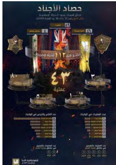
סיכום פיגועי דאעש (אלנבא', טלגרם, 30 ביוני 2022)

אדם, לעומת 131 בני אדם בשבוע שקדם. מספר ההרוגים והפצועים הגדול ביותר היה במחוז מערב אפריקה (44). שאר ההרוגים והפצועים היו במחוזות הבאים: סיני (16); מוזמביק (16); מערב אפריקה (14); ח'ראסאן (9); סוריה (7); עיראק (6) (שבועון אלנבא', טלגרם, 30 ביוני 2022).