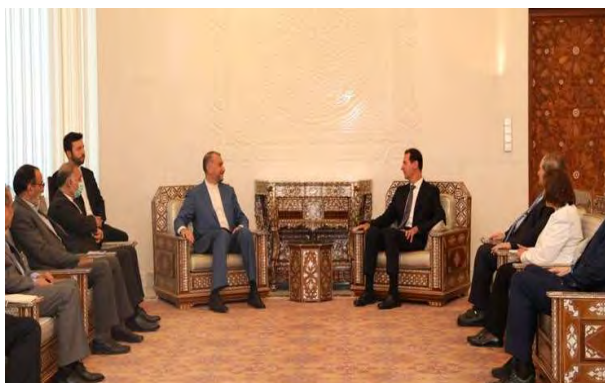
פגישת שר החוץ האיראני עם נשיא סוריה (פארס, 2 ביולי 2022)

◀ בפגישתו עם שר החוץ הסורי, פיצל מקדאד (Faisal Mekdad), אמר עבדאללהיאן, כי היחסים בין שתי המדינות הם אסטרטגיים, והדגיש את מחויבות ארצו להמשך התמיכה בסוריה וב"התנגדות" לשם הבטחת ביטחון האזור. שר החוץ הסורי הודה לעמיתו האיראני על מאמצי איראן לסייע בפתרון חילוקי הדעות בין סוריה לתורכיה על רקע כוונתה לבצע מהלך צבאי בצפון סוריה. בפגישתו עם הנשיא בשאר אסד גינה עבדאללהיאן את העדר התגובה מצד מדינות המערב להמשך התקיפות הישראליות בסוריה ואמר, כי הדבר מעיד על כך שהן אינן מעוניינות ביציבותה ובביטחונה של סוריה. הוא הדגיש את הצורך בשמירת לכידותה הטריטוריאלית של סוריה ואת התנגדות איראן לכל פעולה צבאית בשטחה. הנשיא אסד הודה לאיראן על מאמציה לקידום פתרון מדיני למשבר בארצו והצהיר, כי המאזן באזור משתנה לטובת סוריה (פארס, 2 ביולי 2022).