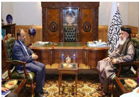
פגישת סגן שגריר איראן בקאבול עם סגן שר החוץ של הטאלבאן (5 ביולי 2022)