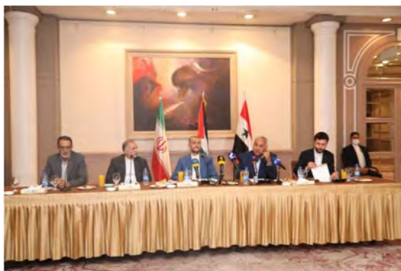
פגישת שר החוץ האיראני עם ראשי הארגונים הפלסטינים בדמשק (איסנ"א, 3 ביולי 2022)

◀ שר החוץ האיראני, חסין-אמיר עבדאללהיאן, נפגש במהלך ביקורו בדמשק ב-3 ביולי 2022 עם נציגי הארגונים הפלסטינים היושבים בסוריה והדגיש את תמיכתה הנמשכת של איראן בעניין הפלסטיני. במהלך הפגישה אמר שר החוץ האיראני, כי סוגיית פלסטין היא הסוגייה הראשונה במעלה עבור העולם האסלאמי וכי תמיכת איראן בהתנגדות העם הפלסטיני תימשך עד לשחרור מולדתו וכינונה של מדינה פלסטינית אחת שבירתה ירושלים. הוא גינה את נכונותן של חלק ממדינות האזור לנרמל את יחסיהן עם ישראל והצהיר כי מדובר בבגידה בעניין הפלסטיני. עבדאללהיאן הוסיף, כי "המשטר הציוני" חלש ונבוך מאוד מול "ציר ההתנגדות" ומנסה, לפיכך, להסיט את דעת הקהל העולמית באמצעות שקרים והגזמות. הוא הצהיר, כי איראן אינה מבחינה בין שיעים לסונים ותומכת במקביל הן בג'האד האסלאמי ובחמאס הסוניות והן בחזבאללה השיעית (איסנ"א, 3 ביולי 2022).