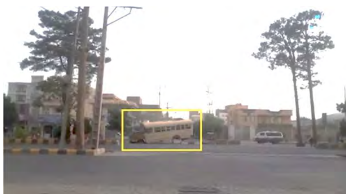
אחד משני האוטובוסים שהותקפו בעיר הראט (מתוך סרטון שפרסמה סוכנות אעמאק, טלגרם, 6 ביולי 2022)

דאעש נהרג והשני נמלט (טלגרם, 6 ביולי 2022). תנועת הטאלבאן ציינה כי שניים מאנשיה נהרגו בפיגוע, אך יתכן שמדובר ביותר, שכן התנועה מנעה כניסת עיתונאים לאזור (afintl.com, 7 ביולי 2022).