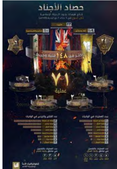
סיכום פיגועי דאעש (אלנבא', טלגרם, 7 ביולי 2022).