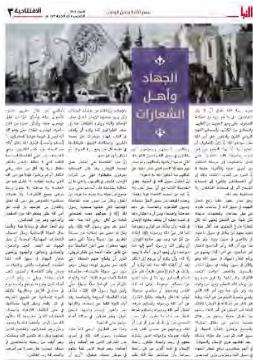
מאמר המערכת בשבועון דאעש, אלנבא' (אלנבא', טלגרם, 7 ביולי 2022).

◀ מאמר המערכת של שבועון דאעש, אלנבא', שהתפרסם השבוע תחת הכותרת "הג'האד ואנשי הסיסמאות", עסק במחויבות הארגון לרעיון הג'האד האלים נגד "הכופרים" תוך הצגת הארגונים הג'האדיים האחרים כצבועים, המשתמשים בג'האד כסיסמה בלבד (אלנבא', טלגרם, 7 ביולי 2022).