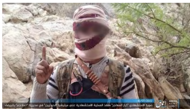
מחבל מתאבד שביצע הפיגוע נגד החות'ים (אעמאק, טלגרם, 10 ביולי 2022)

ב-9 ביולי 2022, הפעיל מחבל מתאבד של דאעש, רכוב על אופנוע, אפוד נפץ שנשא על גופו סמוך לשיירה בה נסעו מפקדי התנועה החות'ית הפרו-איראנית באזור עפאר כ-160 ק"מ מדרום מזרח לצנעאא'. מספר חות'ים נהרגו או נפצעו. דאעש ציין כי המחבל המתאבד הוא כראר אלמהאג'ר (המהגר) וכי החות'ים הטילו איפול מלא על האירוע (אעמאק, טלגרם, 10 ביולי 2022).