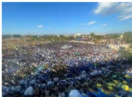
ההתכנסות הראשונה, בהיפודרום בצור (חשבונות הטוויטר של מחמד באקר ומאיא123, 1 ביולי 2022)