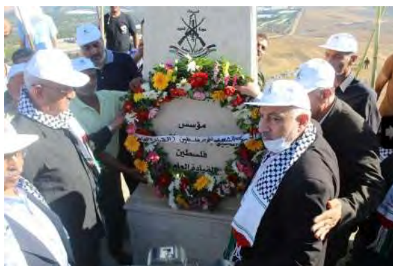
האנדרטה לאחמד ג'בריל בגינת איראן במארון אלראס (אלמנאר, 9 ביולי 2022)

◀ החזית העממית לשחרור פלסטין – המפקדה הכללית ציינה את יום השנה למותו של אחמד ג'בריל המייסד והמזכ"ל שלה, בטקס אזכרה שהתקיים בגינת איראן במארון אלראס, סמוך לגבול ישראל-לבנון. בתוך כך, נחנכה במקום אנדרטה לג'בריל, בהשתתפות נציגים מחזבאללה, מהארגונים הפלסטיניים ומשגרירות איראן בלבנון (אתר אלעהד, 8 ביולי 2022).