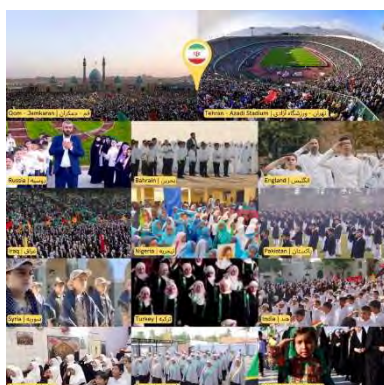
אחד מכינוסי השירה בציבור בהשתתפות שיעים מכל רחבי העולם: איראן, בריטניה, בחרין, רוסיה, פקיסטן, ניגריה, עיראק, הודו, תורכיה, סוריה, אפגניסטן, טנזניה ומיאנמר (חשבון הטוויטר "צעירי חזבאללה", 2 ביולי 2022)