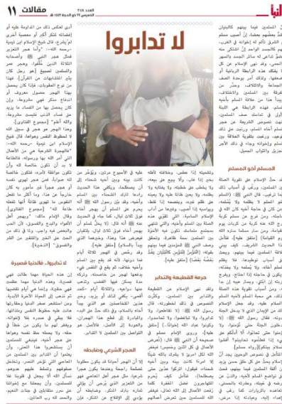
נוסח המאמר (אלנבא', טלגרם, 21 ביולי 2022).

◀ בשבועון אלנבא' של דאעש, התפרסם מאמר תחת הכותרת "אל תתכרו זה לזה" ("ולא תדאברוא"), הטוען כי האסלאם מורה להימנע מחילוקי-דעות ולפיצול בין המוסלמים וקורא להדק את הקשרים בין המאמינים. הארגון הודה במשתמע בקיומם של חילוקי-דעות בין פעיליו, וציון כי חילוקי-הדעות מזיקים לדאעש, מעכבים את ניצחון הארגון ומאפשרים לאויבי הארגון להכריע אותו (אלנבא', טלגרם, 21 ביולי 2022).