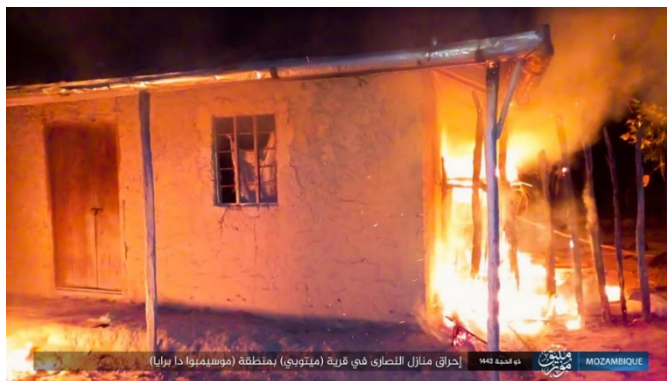
אחד מבתי הנוצרים, שהועלו באש בכפר מיטובה, שבמחוז קאבו דלגאדו (טלגרם, 25 ביולי 2022).