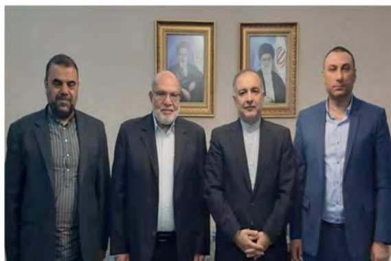
פגישת שגריר איראן בסוריה עם נציגי הג'האד האסלאמי (איסנ"א, 22 באוגוסט)

◀ בהתייחסו לסבב הלחימה האחרון בעזה אמר סלאמי, כי אילו העימות היה מתרחב, כלל הקבוצות הפלסטיניות, לרבות חמאס ופתח, היו מתערבות בלחימה, אך מאחר שהג'האד האסלאמי הצליח לנהל את המערכה בעצמו, לא היה צורך בהתערבות יתר הקבוצות, שתמכו בו מבחינה מורלית. הוא ציין, כי האסטרטגיה של "ההתנגדות" היא לכפות על האויב לקבל את תנאי הפלסטינים באמצעות עימותים מוגבלים וקצרים וכי הוכח ש"המשטר הציוני" אינו מסוגל להילחם אפילו נגד קבוצה אחת של "ההתנגדות", והביא כראייה לכך את רצונה של ישראל לסיים את הלחימה. סלאמי אמר, כי כשם שעזה התחמשה, כך גם הגדה המערבית יכולה להתחמש וכי תהליך זה כבר החל ונמצא בעיצומו. הוא ציין, כי אין כל קושי לייצר אמצעי לחימה ולהעבירם ממקום למקום. הוא ציין, כי בפגישתו בטהראן עם מזכ"ל הג'האד האסלאמי, זיאד נח'אלה, במהלך סבב הלחימה האחרון בעזה דנו השניים בשחיקת כוחם של הציונים בהשוואה לעבר. סלאמי אמר, כי הפלסטינים מאמינים שישראל בשקיעה, שעוצמתה נשחקת עם הזמן וכי בעתיד הקרוב יוכלו להפוך לבעלים של ארצם. ◀ שגריר איראן בסוריה, מהדי סבחאני (Mehdi Sobhani), נפגש ב-22 באוגוסט 2022 עם נציגי הג'האד האסלאמי הפלסטיני בדמשק. בהודעת שגרירות איראן בדמשק נאמר, כי הפגישה דנה בהתפתחויות ברצועת עזה ובגדה המערבית ובסבב הלחימה האחרון בעזה (מבצע "עלות השחר") וכי השגריר האיראני שיבח את "התנגדות הג'האד" במאבק נגד "המשטר הציוני" (איסנ"א, 22 באוגוסט 2022).