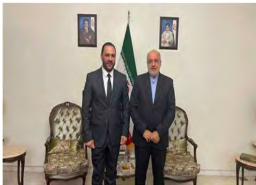
פגישת שגריר איראן בבירות עם מזכ"ל מפלגת הבעת' הלבנונית (איסנ"א, 28 באוגוסט)

◀ שגריר איראן בבירות, מג'תבא אמאני (Mojtaba Amani), אמר בפגישה עם מזכ"ל מפלגת הבעת' הלבנונית, עלי חג'אזי (Ali Hijazi), כי איראן מוכנה לשלוח דלק ללבנון אם ממשלת לבנון תסכים לכך ותשלח משלחת רשמית לטהראן כדי לדון בעניין זה. חג'אזי הביע צער על כך שממשלת לבנון לא קיבלה עד כה את הצעותיה של איראן לספק דלק ללבנון חרף מצוקת הדלק במדינה (איסנ"א, 28 באוגוסט 2022).