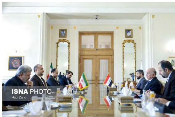
פגישת שרי החוץ של איראן ועיראק (איסנ"א, 29 באוגוסט)

לממש את ההסכמים, שנחתמו בין שתי המדינות, ולהרחיב את הקשרים המסחריים והכלכליים ביניהן. הוא הצהיר, כי איראן מייחסת חשיבות רבה לשמירת היציבות והאחדות הלאומית בעיראק וסבורה שיש לפתור את חילוקי הדעות הפנימיים במדינה במסגרת החוק ותוך שמירת מעמדה של ממשלת עיראק (תסנים, 29 באוגוסט 2022).