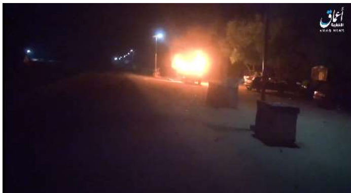
כלי רכב של משטרת ניגריה עולה באש במחסום בעיירה מונגונו (אעמאק, טלגרם, 16 באוקטובר 2022).

◀ בוצע ירי ב-13 באוקטובר 2022 לעבר סויר של צבא ניגריה בעיירה מאלם פטורי. החיילים נמלטו ולא דווח על נפגעים (טלגרם, 13 באוקטובר 2022).