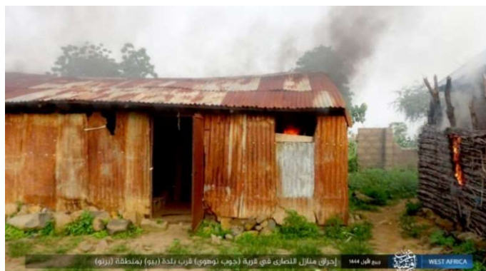
בתי אזרחים נוצרים עולים באש בכפר הנוצרי ג'ופ נוהוי, בצפון-מזרח ניגריה (טלגרם, 17 באוקטובר 2022).

◀ בוצעה תקיפה ב-10 באוקטובר 2022 נגד הכפר הנוצרי ג'ופ נוהוי, שבקרבת העיירה ביו (Biu), כ-165 ק"מ מדרום-מערב למידוגורי. האזרחים נמלטו. כנסיה ובתי אזרחים הועלו באש (טלגרם, 13 באוקטובר 2022).