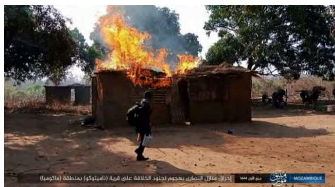
בית אזרח עולה באש בכפר נמיטוקו (טלגרם, 14 באוקטובר 2022).

◀ בוצעה תקיפה ב-10 באוקטובר 2022 נגד הכפר הנוצרי נמיטוקו, באזור מקומיה (Macomia). בתי אזרחים הועלו באש (טלגרם, 14 באוקטובר 2022).