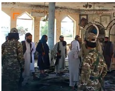
הרס שנגרם למסגד בעקבות הפיגוע (חשבון הטוויטר של ערוץ הלויין דג'לה, 5 באוקטובר 2022)

◀ מחבל מתאבד פוצץ ב-5 באוקטובר 2022 מטען שנשא על גופו בתוך מסגד השייך למשרד הפנים האפגאני, הממוקם במתחם מאובטח, בסמוך לרחוב ראשי ושדה התעופה הבינלאומי של קאבול. באותה עת התפללו במקום עובדי המשרד ומבקרים (אשושאיטד פרס, 5 באוקטובר 2022). לטענת משרד הפנים של הטאלבאן, שמונה בני אדם נהרגו ועשרים נפצעו (חשבון הטוויטר ete_plus_news@ete_plus, 5 באוקטובר 2022). מקור נוסף ציין כי בפיגוע נהרגו 25 בני אדם ועשרות נפצעו. עד כה לא קיבל ארגון כלשהו אחריות לביצוע הפיגוע אך ככל הנראה המדובר בדאעש (OrientNews, 5 באוקטובר 2022).