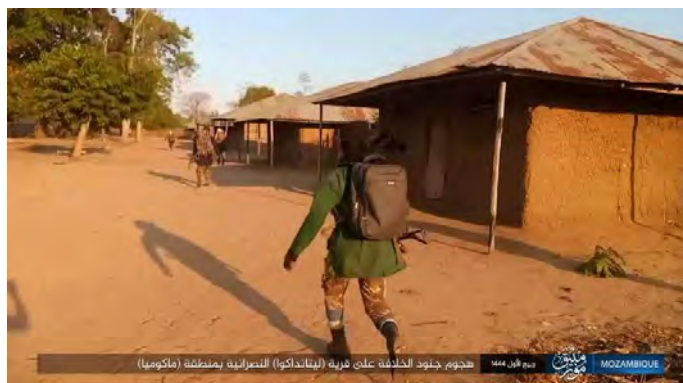
פעילי דאעש בכפר ליטנדאקו (טלגרם, 17 באוקטובר 2022).

◀ בוצע ירי ב-12 באוקטובר 2022 לעבר סיור של צבא מוזמביק בכפר ליטנדאקו, שבאזור מקומיה (Macomia), במזרח מחוז קאבו דלגאדו. חייל אחד נהרג והשאר נמלטו. שני מטולי אר.פי.ג'י., שני רובי סער ותחמושת נלקחו (טלגרם, 14 באוקטובר 2022).