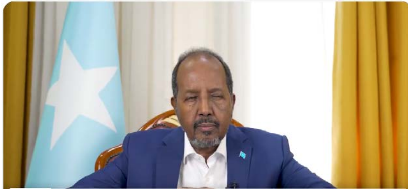
חסן שייח' מוחמוד

◀ בתחילת יולי 2022, הציג נשיא סומאליה את האסטרטגיה שפיתח למיגור אלשבאב לפיה, הוא יישא וייתן עם אלשבאב בזמן המתאים לאחר שיוחלש הארגון באמצעות שילוב של מאבק צבאי, פיננסי ואידיאולוגי (The New Arab, 6 ביולי 2022).