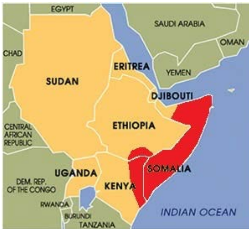
מדינות קרן אפריקה (אזור הפעילות של אלשבאב מסומן באדום) (Halbeeg News, 8 באפריל 2018).

◀ ב-30 באוגוסט 2022, פרסמה הנהגת אלקאעדה את הגיליון השביעי של כתב העת האומה האחת (אלאמה אלואחדה), אותו הקדישה לסומאליה. במאמר הפותח איחלה לשלוחתה בסומאליה, חרכת אלשבאב אלמג'אהדין, ניצחון קרוב על ממשלת סומאליה בדומה לניצחון הטאליבאן באפגניסטן, השתלטות על מוגדישו, בירת המדינה, וגירוש כל הכוחות הזרים משטחה. הנהגת אלקאעדה אף טענה כי בידה יהיה המפתח לפתרון סוגיות אזרחיות בקרן אפריקה, כדוגמת תיגראי 1 וסכר התחייה 2 (טלגרם, 30 באוגוסט 2022).