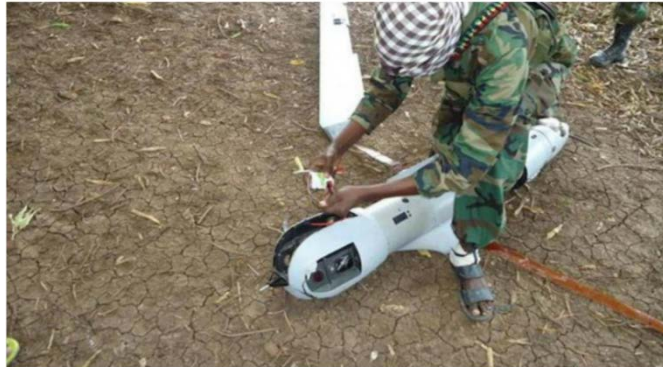
פעיל אלשבאב וכלי טיס בלתי מאויש