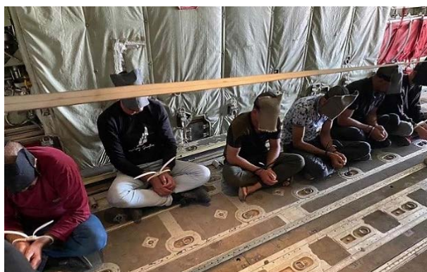
ששת פעילי דאעש העצורים (דף הפייסבוק SecMedCell, 19 באוקטובר 2022)

◀ כוח של צבא עיראק עצר ב-19 באוקטובר 2022 שישה פעילי דאעש בולטים, שהיו מבוקשים על-ידי כוחות הביטחון העיראקיים (דף הפייסבוק SecMedCell, 19 באוקטובר 2022).