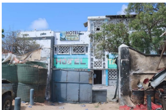
המלון תוכל (שהיה היעד לתקיפת ארגון אלשבאב (חשבון הטוויטר Somalia Eye@somalia_eye, 24 באוקטובר 2022)

◆ ב-19 באוקטובר 2022 הופעלה מכונית תופת במחסום סמוך למבנים ממשלתיים ובסיס צבאי של כוח שמירת השלום מג'יבוטי, המשתייך לאיחוד האפריקני (African Union), בעיירה ג'לאלאקזי (Jalalaqzi), במחוז היראן (Hiran) שממערב למוגדישו. 15 בני אדם נהרגו, ביניהם ראש העיירה, מפכ"ל משטרת המחוז, חיילים שאיישו את המחסום ואזרחים עוברי אורח (VOA, 19 באוקטובר 2022). ◆ ב-19 באוקטובר הופעל אופנוע ממולכד על גשר העיירה בולוברדה (Bulobarde), כ-190 ק"מ צפונית למוגדישו, המחבר בין האזור הדרומי למרכז סומליה. ששה בני אדם, בהם ארבעה אזרחים, נהרגו. נזק נגרם לגשר (VOA, 19 באוקטובר 2022).