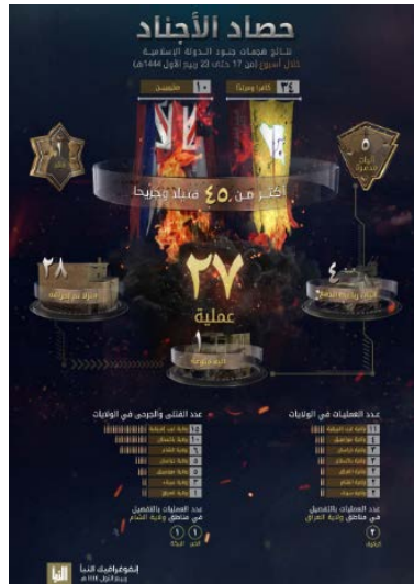
סיכום פיגועי דאעש (אלנבא', טלגרם, 20 באוקטובר 2022) פיגועים בחתך שבועי (על-פי נתוני הארגון)

◀ מנתוני אינפוגרף המסכם את הפעילות בתקופה שבין 13-19 באוקטובר 2022, עולה כי בתקופה זו ביצעו פעילי הארגון 27 פיגועים במחוזות השונים (לעומת 20 בשבוע שקדם). מספר הפיגועים הגבוה ביותר בוצע על-ידי מחוז מערב אפריקה (11). בשאר המחוזות: מוזמביק (4); ח'ראסאן (אפגניסטאן) (3); פקיטאן (3); עיראק (2); סוריה (2); סיני (2). בפיגועים נהרגו ונפצעו 45 בני אדם, לעומת 54 בני אדם בשבוע שקדם. מספר ההרוגים והפצועים הגדול ביותר היה במחוז מערב אפריקה (15). שאר ההרוגים והפצועים היו במחוזות הבאים: פקיטאן (10); סוריה (6); ח'ראסאן (אפגניסטאן) (5); מוזמביק (5); סיני (3); עיראק (1) (שבועון אלנבא', טלגרם, 20 באוקטובר 2022). מדובר בהמשך פעילות בהיקף נמוך יחסית של הארגון. אפריקה ממשיכה להוביל במספר הפיגועים.