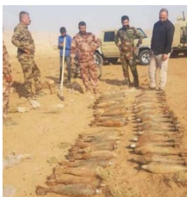
פצצות מרגמה שאותרו מצפון למוצול (חשבון הטוויטר של מנהלת הגיוס העממי, 25 באוקטובר 2022)

◀ כוח של הגיוס העממי איתר מאגר אמצעי לחימה של דאעש, שכלל כארבעים פצצות מרגמה, באזור אלסמאקיה, שמצפון למוצול (חשבון הטוויטר של מנהלת הגיוס העממי, 25 באוקטובר 2022).