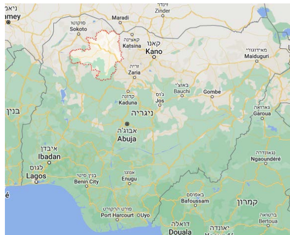
מדינת זאמפארה (Zamfara), שבצפון-מערב ניגריה

◀ ממשל מדינת זאמפארה (Zamfara), בצפון-מערב ניגריה, הודיע כי פעילי מחוז מערב אפריקה של דאעש ופעילי בוקו חראם הקימו מחנות במדינה. זהו דיווח ראשון של ממשל מדינת זאמפארה על קיומם של מחנות כאלה בשטחה מה שיכול להעיד שדאעש ובוקו חראם פועלים להרחבת פעילותם בצפון-מערב המדינה. זאת, ככל הנראה בשל הלחץ שמפעיל צבא ניגריה על הארגונים במדינת בורנו, בצפון-מזרח ניגריה. מדינת זאמפארה גובלת בחלקה הצפון-מערבי בניז'ר, וקרוב לוודאי שהדבר משמש את פעילי הארגונים לצורכי אספקה, מילוט וקשירת קשרים עם התארגנויות אסלאמיות הפועלות מעבר לגבול (ערוץ היוטיוב TVC News Nigeria, 18 באוקטובר 2022).