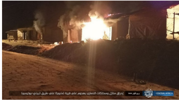
בתי נוצרים עולים באש בכפר מבויה (טלגרם, 24 באוקטובר 2022)