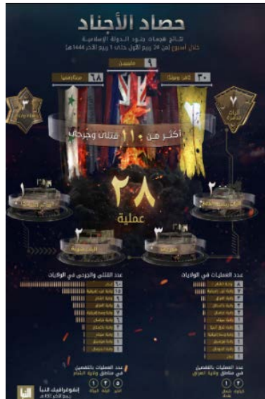
סיכום פיגועי דאעש (אלנבא', טלגרם, 27 באוקטובר 2022) פיגועים בחתך שבועי (על-פי נתוני הארגון)

◀ מנתוני אינפוגרף המסכם את הפעילות בתקופה שבין 20-26 באוקטובר 2022, עולה כי בתקופה זו ביצעו פעילי הארגון 28 פיגועים במחוזות השונים (לעומת 27 בשבוע שקדם). מספר הפיגועים הגבוה ביותר בוצע על ידי מחוז סוריה (8). בשאר המחוזות: מערב אפריקה (7); עיראק (3); פקיסטאן (2); ח'ראסאן (אפגניסטאן) (2); סיני (1); מזרח אסיה (1); מרכז אפריקה (1); מוזמביק (1); סומליה (1); איראן (1). בפיגועים נהרגו ונפצעו 110 בני אדם, לעומת 45 בני אדם בשבוע שקדם. מספר ההרוגים והפצועים הגדול ביותר היה באיראן (60), כתוצאה בפיגוע הירי במקדש בעיר שיראז. שאר ההרוגים והפצועים היו במחוזות הבאים: מערב אפריקה (15); סוריה (9); עיראק (8); מרכז אפריקה (7); ח'ראסאן (אפגניסטאן) (6); פקיסטאן (2); סיני (1); מוזמביק (1); סומליה (1) (שבועון אלנבא', טלגרם, 20 באוקטובר 2022).