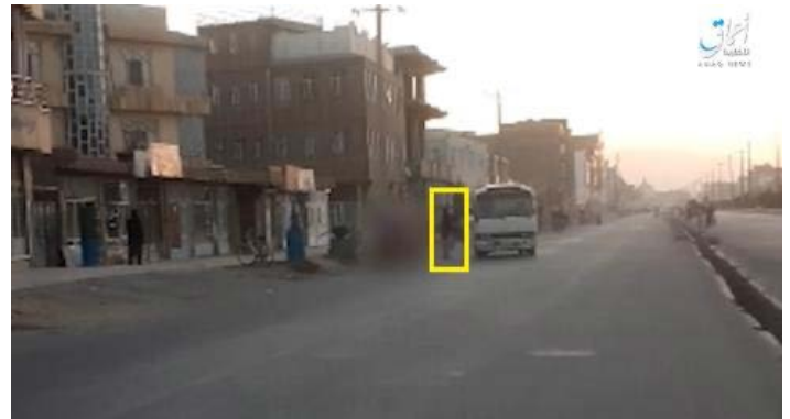
מבצע הפיגוע בצע ירי לעבר המיניבוס ומשמאל משליך לתוכו רימון-יד (מתוך הסרטון של אעמאק, טלגרם, 29 באוקטובר 2022)