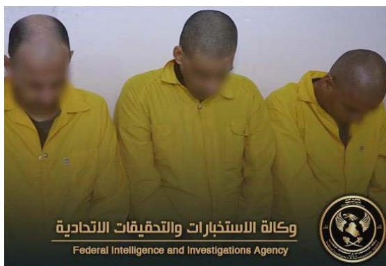
שלושת פעילי דאעש העצורים במחוז כרכוכ