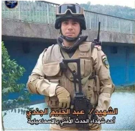
אחד השוטרים שנהרגו (דף הפייסבוק סינאא' מאשר, 31 בדצמבר 2022)

דאעש קיבל אחריות על ביצוע הפיגוע. בהודעה צוין כי פעילי הארגון תקפו באמצעות מקלעים את המחסום המשטרתי וכי לפחות שלושה שוטרים נהרגו ו-12 בני אדם נפצעו, ביניהם קצין (טלגרם, 31 בדצמבר 2022).