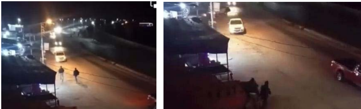
תמונות מהסרטון האבטחה המתעד את האירוע (חשבון הטוויטר מעאלי אלמואטן, 31 בדצמבר 2022)

בסרטון שצולם במצלמת אבטחה במקום תועדה חלק מהתקרית. בסרטון נראים אנשי ביטחון מצריים יורים ולאחר מכן מסתערים לעבר כביש שבו נוסעות מספר מכוניות (חשבון הטוויטר mohammed, 30 בדצמבר 2022; חשבון הטוויטר מעאלי אלמואטן, 31 בדצמבר 2022).