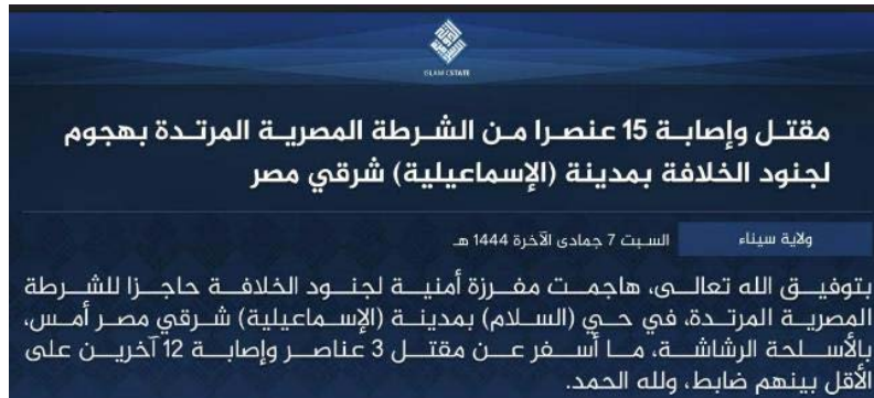
הודעת דאעש בה קיבל אחריות על הפיגוע (טלגרם, 31 בדצמבר 2022).

דאעש קיבל אחריות על ביצוע הפיגוע. בהודעה צוין כי פעילי הארגון תקפו באמצעות מקלעים את המחסום המשטרתי וכי לפחות שלושה שוטרים נהרגו ו-12 בני אדם נפצעו, ביניהם קצין (טלגרם, 31 בדצמבר 2022).