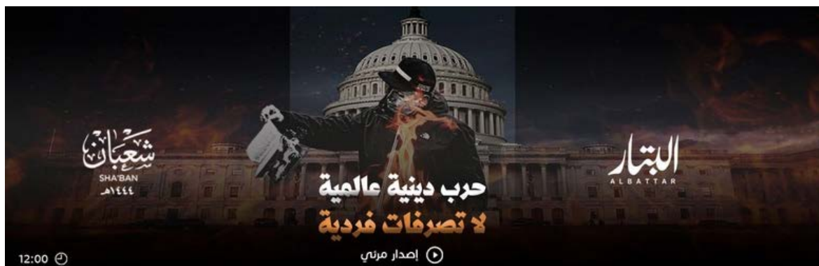
פתיח הסרטון (טלגרם, 24 בפברואר 2023)

◀ פתיח הסרטון בצרפתית יכול אולי לרמז שהוא הופק במדינה דוברת צרפתית. הבחירה בכותרת הסרטון "מלחמת דת עולמית – לא התנהלות אישית" נועדה לעודד קמפיין נרחב ולא פעולות ספורדיות אולי בשל העובדה שעד עתה לקריאה לבצע פיגועים נגד הנוצרים לא הייתה היענות.