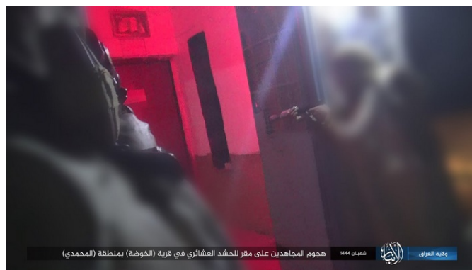
פעילי דאעש מבצעים ירי לעבר המפקדה של הגיוס השבטי (טלגרם, 27 בפברואר 2023)

ב-26 בפברואר 2023 בוצע ירי והושלך רימון-יד לעבר מפקדה של כוחות הגיוס השבטי בכפר אלח'וצ'ה, כארבעים ק"מ מצפון-מערב לאלרמאדי. מפקד ושלושה לוחמים נהרגו. שני רובי סער ואקדח נלקחו שולל, שני כלי רכב הושבתו (טלגרם, 26 בפברואר 2023).