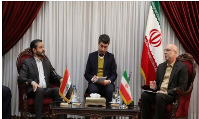
פגישת שר ההשכלה הגבוהה של עיראק ושר המדעים האיראני (פארס, 5 במרץ 2023)

• שר ההשכלה הגבוהה העיראקי, נעים אלעבודי (Naeem al-Aboudi), הגיע בראשית מרץ 2023 לביקור בטהראן. ב-5 במרץ 2023 ביקר השר בארגון האיראני למחקרים מדעיים ותעשייתיים ודן עם שר המדעים, המחקרים והטכנולוגיות האיראני, מחמד-עלי זלפיגל (Mohammad Ali Zolfigol), בהרחבת שיתוף הפעולה הטכנולוגי בין שתי המדינות, לרבות הקמת פארקים טכנולוגיים משותפים. השר העיראקי הביע רצון להרחיב את שיתוף הפעולה המדעי והמחקרי בין המדינות וציין, כי ארצו מוכנה לקלוט סטודנטים איראנים שילמדו במוסדות להשכלה גבוהה בעיראק. שר המדעים האיראני הדגיש את הצורך בהרחבת שיתוף הפעולה המדעי בין המדינות והציע לקיים מפגשים משותפים בין ראשי האוניברסיטאות ומרכזי המחקר והטכנולוגיה באיראן ובעיראק. כמו כן, קרא השר להרחבת לימודי הפרסית באוניברסיטאות בעיראק ולהרחבת לימודי הערבית באוניברסיטאות באיראן (פארס, 5 במרץ 2023).