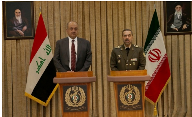
שרי ההגנה של איראן ועיראק (defapress.ir, 25 בפברואר 2023)

• שר ההגנה העיראקי, ת'אבת מחמד אלעבאסי (Thabet Muhammad al-Abbasi), הגיע בסוף פברואר 2023 לטהראן ונפגש עם בכירי הממשל באיראן. זהו ביקורו הראשון באיראן לאחר כינון הממשלה העיראקית החדשה. ב-25 בפברואר 2023 נועד אלעבאסי עם שר ההגנה האיראני, מחמד רזא אשתיאני (Mohammad Reza Ashtiani), ודן עימו בשיתוף פעולה לביסוס הביטחון בגבולות. אשתיאני טען, כי נוכחותן של קבוצות טרור בעיראק מהווה איום ממשי על ביטחונה הלאומי של איראן וכי קיים צורך רב יותר מתמיד בתיאום צבאי, מודיעיני וביטחוני בין שתי המדינות. עוד ציין שר ההגנה האיראני, כי התערבות מדינות זרות באזור נועדה להבטיח את ביטחון "המשטר הציוני". אשתיאני הביע את נכונות ארצו להעמיד לרשות עיראק את היכולות, שפיתחה בתעשיות הביטחוניות שלה. שר ההגנה העיראקי הודה לאיראן על תמיכתה וציין, כי הכוחות המזוינים של עיראק מעוניינים לנצל את יכולותיה של איראן לשם הרחבת שיתוף הפעולה הטכני והטכנולוגי בין המדינות (defapress.ir, 25 בפברואר 2023).