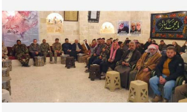
قيادات وعناصر منظمة لواء الباقر في منطقة حلب (العربية، 2 فبراير 2021)

◀ في الآونة الأخيرة، يمكن ملاحظة التعاون والتنسيق بين الميليشيات الأربع الرئيسية التي تسيطر على الأراضي، وذلك بعد سنوات من صراعات القوة والسيطرة، بينها وبين أجهزة الأمن السورية وأمراء الحرب المحليين. يدور الحديث عن لواء الباقر، ولواء زين العابدين، ولواء القدس الفلسطيني (المدعوم من قبل الروس)، وفيلق المدافعين عن حلب، حيث يُعد الأخير بمثابة نوع من المظلة الإدارية والعسكرية غير المباشرة للميليشيات النشطة في قريتي نبل والزهران الشيعيتين، وبالنسبة لأفراد الجماعات المسلحة، من أبناء قريتي كفريا والفوعة الشيعيتين، الذين أُجبروا على النفي من إدلب إلى حلب في عام 2018. سبب الانسجام الحالي: تراجع الدعم المالي الذي تقدمه إيران للميليشيات المحلية، الأمر الذي أجبرها على "تطوير مصادر دخل" جديدة مثل تزييف المخدرات ونقل الركاب وتهريب المخدرات والوقود. أخذ مصدر في المعارضة السورية مطلع على التقرير الانطباع بأن مكتب القنصل الإيراني في حي الزبدية بحلب أصبح شبه مكان "حج" لقادة هذه الميليشيات لضمان بقائهم والحصول على الحماية منهم. هدفها هو تخفيف التوتر مع أجهزة الأمن وممارسة الضغط على جنود الفرقة 4 المنتشرين هناك للسماح لأفرادها بتقاسم أنشطة التهريب والاتجار وإنتاج المخدرات معهم. 75