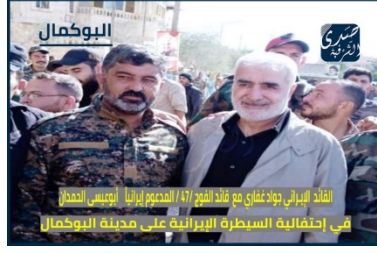
القائد السابق للقوات الإيرانية في سوريا جواد غفاري وقائد الفوج 47 في البوكمال (صفحة sadaa alsharqia على فيسبوك، 14 نوفمبر 2021)

◀ شمالي هذا المكان، في محافظة الحسكة، وردت معلومات منذ نهاية عام 2021، حول وصول أفراد الميليشيات الموالية لإيران، على ما يبدو بحجم عدة مئات من العناصر، إلى "المربعات الأمنية" للجيش السوري في القامشلي والحسكة، وهي منطقة كانت حتى عام 2019 تحت السيطرة الكاملة لدول التحالف الغربي. الهدف الأولي هو تجنيد أبناء القبائل المحلية في الميليشيات الموالية التي يديرها فيلق القدس وحزب الله اللبناني، مما يثير استياء السكان المحليين، الذين غالبيتهم العظمى من السنة. في يونيو 2022، تم تعليق ملصقات في الحسكة تعبر عن "معارضة محاولات إيران وحزب الله التغلغل في المكان، وتجنيد سكان المحافظة وشراء قلوبهم"، خوفاً من تغيير النسيج الديموغرافي للمنطقة. حيث جاء في البيان أن "وجود أفراد الميليشيا اللبنانية بقيادة الحاج مهدي، المنخرطين في توزيع المخدرات وارتكاب الأعمال الإجرامية، يهدد استقرار المنطقة وأمن سكانها... لذلك، لا نريد ولا نرغب بوجود حزب الله اللبناني في مدينتنا". 56