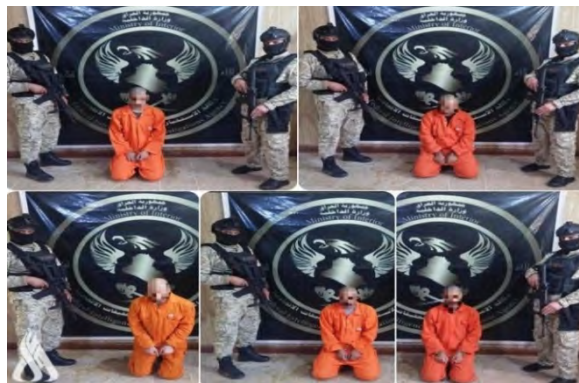
פעילי דאעש, שנעצרו

ב-29 במרץ 2023 הודיעה המנהלת הכללית למודיעין וביטחון במשרד ההגנה על מעצר פעיל דאעש ומבוקש בנפת ביג'י, בצפון מחוז צלאח אלדין וכמאתיים ק"מ מצפון-מערב לבגדאד (סוכנות הידיעות העיראקית, 29 במרץ 2023).