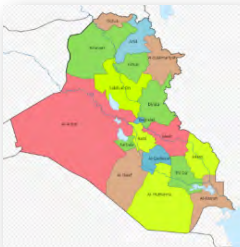
מחוזות עיראק (ויקיפדיה)