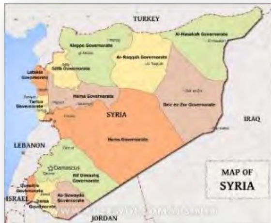
מחוזות סוריה