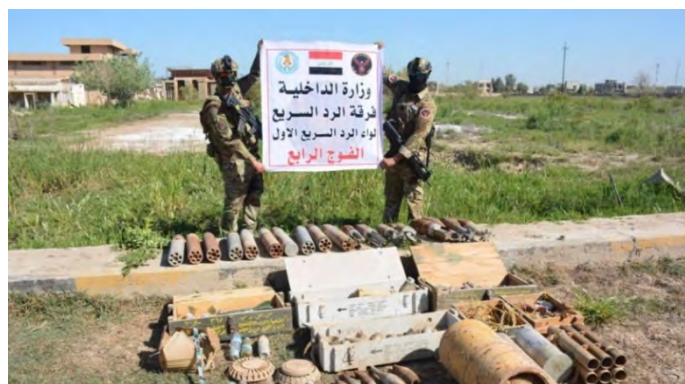
אמצעי לחימה של דאעש, שאותרו במחוז דיאלא (אלסומריה, 1 באפריל 2023)

ב-1 באפריל 2023 ביצע כוח של דיביזיית התגובה המהירה (אלרד אלסריע), הפועלת במסגרת משרד הפנים, סריקות בנפת אלמקדאדיה, כארבעים ק"מ מצפון-מזרח לבעקובה. בסריקות אותר מאגר אמצעי לחימה של דאעש, שכלל פצצות מרגמה, רקטות תקניות, רקטה מייצור עצמי, חומרי נפץ, מוקשים וציוד נוסף (אלסומריה, 1 באפריל 2023).