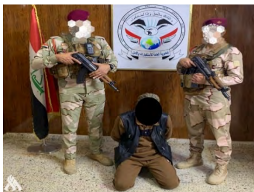
פעיל דאעש שנעצר במחוז צלאח אלדין (סוכנות הידיעות העיראקית, 29 במרץ 2023)

ב-29 במרץ 2023 הודיעה המנהלת הכללית למודיעין וביטחון במשרד ההגנה על מעצר פעיל דאעש ומבוקש בנפת ביג'י, בצפון מחוז צלאח אלדין וכמאתיים ק"מ מצפון-מערב לבגדאד (סוכנות הידיעות העיראקית, 29 במרץ 2023).