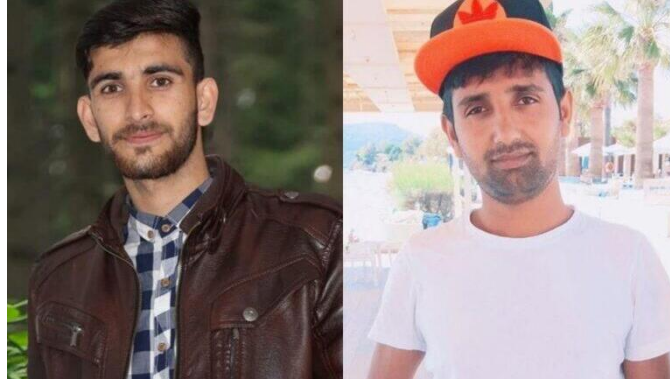
שני החשודים בתכנון פיגוע בהכוונה איראנית ביוון (אמצעי תקשורת יוונים, 29 במרץ 2023)

• שגרירות איראן באתונה הכחישה את הדיווחים. בציף בחשבון הטוויטר שלה (29 במרץ 2023) נאמר, כי מדובר ב"האשמות חסרות בסיס נגד טהראן" וכי "הטענות המפוברקות נועדו להסיט את תשומת הלב ממשבריה הפנימיים" של "הישות הציונית".