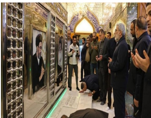
אסמאעיל קאא'ני בעיראק (אלעאלם, 31 במרץ 2023)