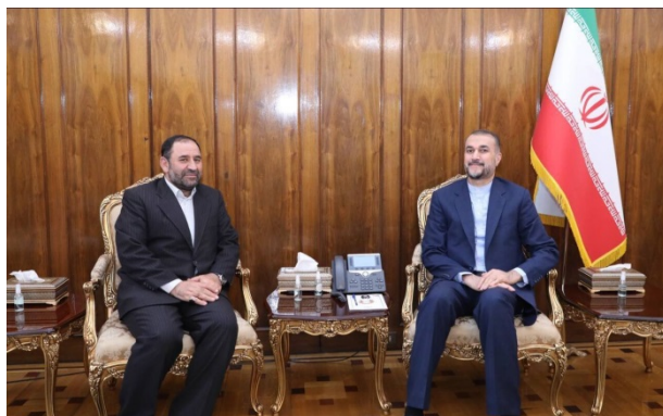
פגישת שגריר איראן הנכנס בדמשק עם שר החוץ האיראני (אירנ"א, 27 במרץ 2023)