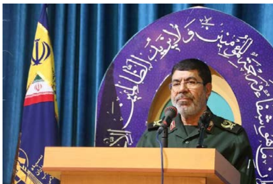
רמז'אן שריף, דובר משמרות המהפכה וראש מטה האנטיפאדה וירושלים (מהר, 29 במרץ 2023)