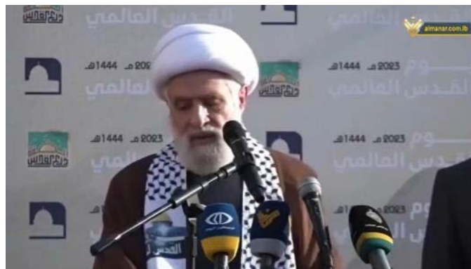
נעים קאסם במהלך הנאום (אלמנאר, 16 באפריל 2023)

◀ נעים קאסם, סגן מזכ"ל חזבאללה , ציין בנאום שנשא בעצרת "הגדה, המגן של ירושלים", שנערכה בסבלין (Siblin), שמצפון לצידון, כי חזבאללה עומד לצד לוחמי הג'יהאד הפלסטינים, בדרך לשחרור פלסטין באמצעות "ההתנגדות", מות הקדושים וסיוע. עוד הוסיף כי הם נמצאים בשלב שבו הם עדים לרפיון ישראל ("ישות הכיבוש") ופירוקה. בעצרת נכח גם אחמד עבד אלהאדי, נציג חמאס בלבנון , שבדברים שנשא ציין כי מה שמייחד את "יום ירושלים העולמי" השנה הוא ש"ציר ההתנגדות" התאחד למען ירושלים וניצח במערכה זו את ישראל (אלמנאר, 16 באפריל 2023).