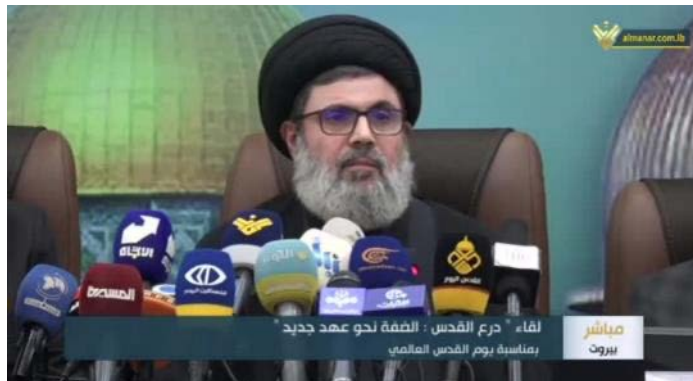
יו"ר המועצה המבצעת של חזבאללה, האשם צפי אלדין (אלמנאר, 12 באפריל 2023)

◀ האשם צפי אלדין, יו"ר המועצה המבצעת של חזבאללה , ציין בדברים שאמר כי הציר [ציר ההתנגדות] איחד את "ההתנגדות" כאשר המטרה נשארה זהה והיא השמדת ישראל . הוא הדגיש שהם מגבירים את כל היכולות שלהם וכי כל פקודה שייתן [ראש ממשלת ישראל, בנימין] נתניהו תיענה במוכנות בכל החזיתות (אלמנאר, 12 באפריל 2023).