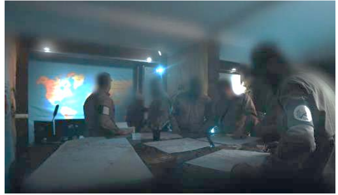
מתוך חדר המבצעים המאוחד: פעילים עם סמלי חמאס, חיבת פאטמיון וחזבאללה בחדר המבצעים המאוחד (טלגרם, 13 באפריל 2023)