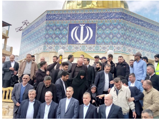
עבדאללהיאן ליד המסגד, הבנוי על-פי דגם כיפת הסלע עליו מוטבע סמל איראן (אלמיאדין, 28 באפריל 2023)

◀ בשולי ביקורו, נועד עבדאללהיאן גם עם זיאד אלנח'אלה, מזכ"ל הג'האד האסלאמי בפלסטין , עבדאללהיאן סקר בפני נח'אלה את מדיניות איראן בנוגע לתמיכה בפלסטינים ואת הצורך באחדות הארגונים הפלסטיניים, אחדות הפלסטינים ככלל ולכידות הממשלות והעמים האסלאמיים בתמיכה בפלסטינים. הוא גם הדגיש את הצורך בנקיטת צעדי הרתעה נגד פעולות ישראל במקומות הקדושים לאסלאם. אלנח'אלה הביע את הערכתו לאיראן על התמיכה שהיא מעניקה להם בפורומים האזוריים והבינלאומיים והדגיש את חשיבות העמדות הללו להעלאת המורל וחיזוק העמידה האיתנה של הפלסטינים. הוא ציין ש"ההתנגדות" נמצאת במצב הטוב ביותר בעשורים האחרונים, והוסיף כי המשברים הפנימיים בישראל הם עדות לחוסר האונים והחולשה של ישראל מולם (אתר משרד החוץ האיראני בערבית, 28 באפריל 2023).