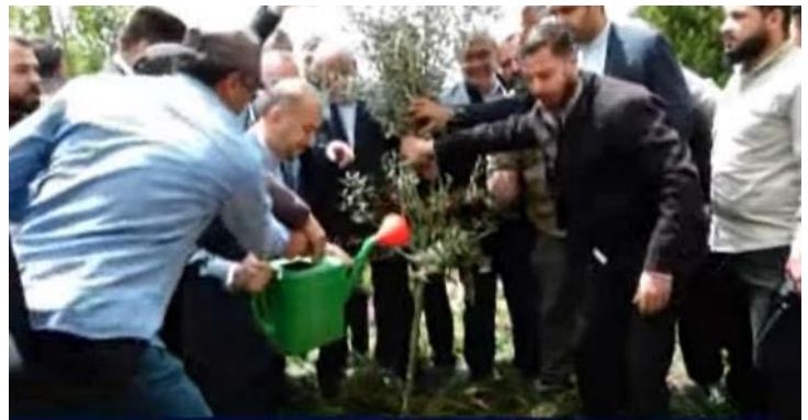
עבדאללהיאן נוטע עץ זית בגן איראן, בו מוצב פסלו של קאסם סלימאני, מפקד כוח קדס לשעבר (אלמיאדין, 29 באפריל 2023)