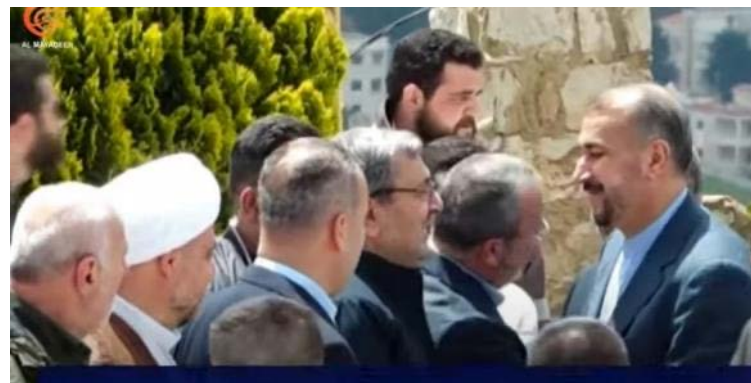
עבדאללהיאן מקבל סקירה, ככל הנראה מפי אנשי חזבאללה, סמוך לגבול עם ישראל (אלמיאדין, 29 באפריל 2023)