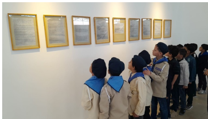
ילדים המבקרים בתערוכה צופים במכתבי אסירים (מימין: דף הפייסבוק של תערוכת "אנו נושמים חופש", 25 באפריל 2023; משמאל: דף הפייסבוק של מוסד "רואסי פלסטין", 24 באפריל 2023)