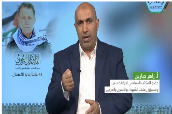
בכיר חמאס זאהר ג'בארין נושא נאום מוקלט לבאי התערוכה במעמד נעילת האירוע (דף הפייסבוק של תערוכת "אנו נושמים חופש", 29 באפריל 2023)

◀ ב-29 באפריל 2023, יום נעילת התערוכה, שודר לבאי התערוכה נאום מוקלט של זאהר ג'בארין, חבר הלשכה המדינית של חמאס ואחראי תיק השהידים, האסירים והמשוחררים . בנאומו התייחס ג'בארין למאבקם הממושך של האסירים הפלסטיניים בבתי הכלא בישראל ואת רצונם לחופש. הוא ציין, כי התערוכה מבליטה את העובדה שהאסירים הפלסטיניים הפכו את תאי הכלא שלהם למשואות אור, בעוד ישראל רצתה להפוך אותם לקברים. בסיום דבריו הוא בירך את האסירים ואת כל הגופים ואמצעי התקשורת שפעלו להצלחת תערוכה זו (דף הפייסבוק של התערוכה בעזה, 29 באפריל 2023).