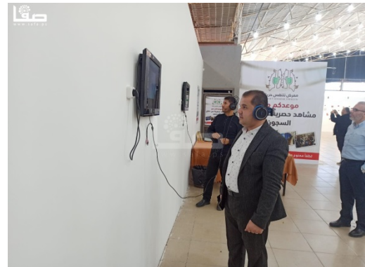
מימין: הפינה בתערוכה שבה הוקרן קטע הוידאו (צפא, 27 באפריל 2023). משמאל: תמונת אסיר מתוך קטע הוידאו (דף הפייסבוק של אגודת "ואעד", 24 באפריל 2023)