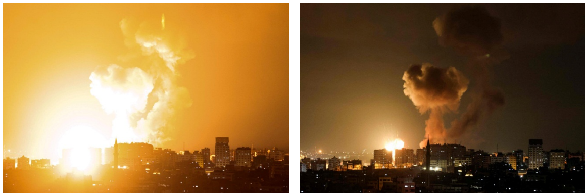
תיעוד תקיפת חיל האוויר בעזה (חשבון הטוויטר של QUDSN, 2 במאי 2023)