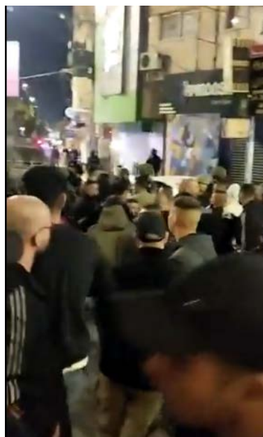
פיזור ההפגנה והעימותים בג'נין (חשבון הטוויטר של צפא, 2 במאי 2023)