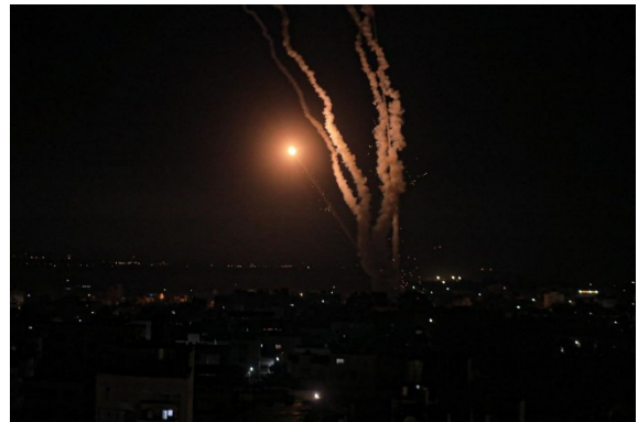
תיעוד ירי רקטות לעבר ישראל. ניתן לראות כי הירי מבוצע מתוך אזורי אוכלוסיה אזרחית