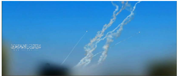
תמונות מסרטון של פלוגות ירושלים המתעד שיגורי רקטות (אתר פלוגות ירושלים, 3 במאי 2023)