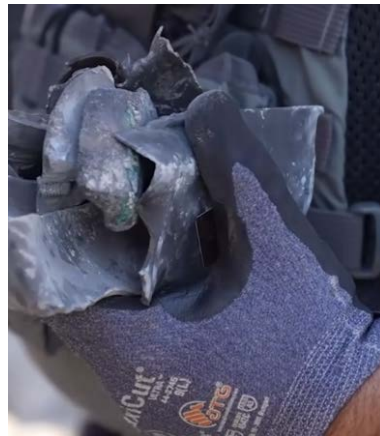
חלקי רקטה שנפלה באתר בנייה בשדרות