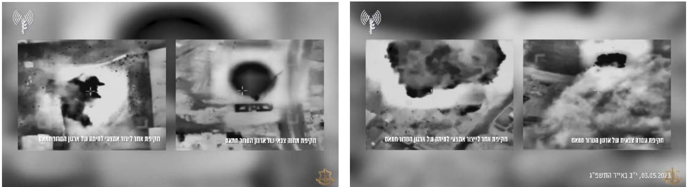
מימין: תקיפת עמדה צבאית ואתר לייצור אמצעי לחימה של חמאס. משמאל: תקיפת מחנה צבאי ואתר לייצור אמצעי לחימה של חמאס (חשבון הטוויטר של דובר צה"ל, 3 במאי 2023)