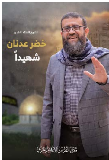
ח'צ'ר עדנאן (אתר פלוגות ירושלים, 2 במאי 2023)

◀ מעצרו האחרון היה ב-5 בפברואר 2023, כאשר כוחות הבטחון הישראליים פשטו על ביתו בעראבה, ומיד עם מעצרו הוא הכריז על שביתת רעב. הוא המשיך בה במשך 86 יום עד מותו ב-2 במאי 2023 (פאלטודיי, 2 במאי 2023; ערוץ הטלגרם Daffa_media [ערוץ הטלגרם של הג'האד האסלאמי בגדה המערבית], 2 במאי 2023). שביטות הרעב התכופות שלו הפכו אותו לסמל וכדמות חיקוי עבור אסירים רבים ששבתו רעב בעקבותיו.