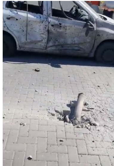
מימין: נפילת רקטה בשדרות (חשבון הטוויטר של חסן אצליח, 2 במאי 2023. משמאל: נזק מנפילת רקטה באתר בנייה בשדרות (דף הפייסבוק של משטרת ישראל, 2 במאי 2023)