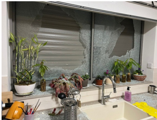
תוצאות פגיעת רקטה באזור אשקלון