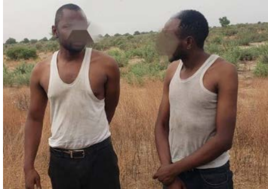
שני עובדי סיוע, שחולצו על-ידי כוח של צבא ניגריה (Zagazola, 4 במאי 2023)

◆ ב-4 במאי 2023 שחרר כוח של צבא ניגריה, שניהל חילופי-אש עם פעילי טרור על ציר באנקי (Banki), בסמוך לגבול ניגריה-קמרון, שניים מתוך שלושת עובדי הסיוע ההומניטרי, שנחטפו בליל 25-26 באפריל 2023 על-ידי פעילי בוקו חראם או דאעש (Zagazola, 4 במאי 2023; הגארדיאן, 4 במאי 2023).