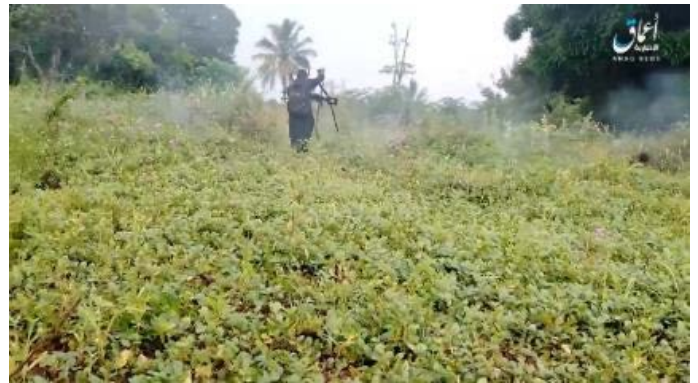
פעילי דאעש תוקפים עמדה של צבא מוזמביק (טלגרם, 6 במאי 2023)