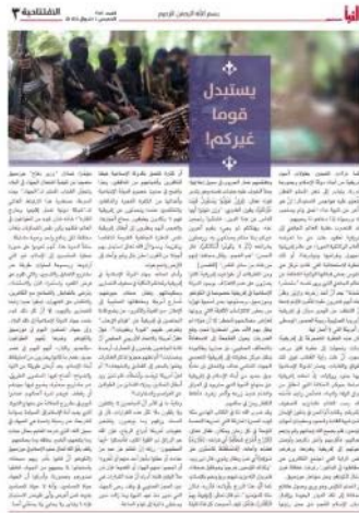
המאמר "[אללה] החליף אתכם בעם אחר [שימשיך את הג'האד]" (שבועון אלנבא', טלגרם, 4 במאי 2023)

◀ כתב המאמר מסיים בקביעה, כי זהו עידן חדש עבור אפריקה, עידן של ג'האד. עידן שהחל כאשר המוסלמים באפריקה אימצו את השריעה ואת עקרון הח'ליפות, לאחר שהזהות האסלאמית שלהם הייתה חלשה. בעקבות זאת, אללה הצליח את דרכם במוזמביק, ברפובליקה הדמוקרטית של קונגו ובמקומות נוספים באופן שמהווה גאווה למוסלמים כולם, שכן ללא הג'האד, אין חיים למוסלמים (שבועון אלנבא', טלגרם, 4 במאי 2023).