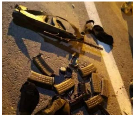
הרובה, מחסניות והאקדח שנמצאו בזירת הפיגוע (אלערביה, 9 במאי 2023)