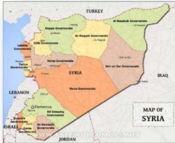
מחוזות סוריה (Free world maps)