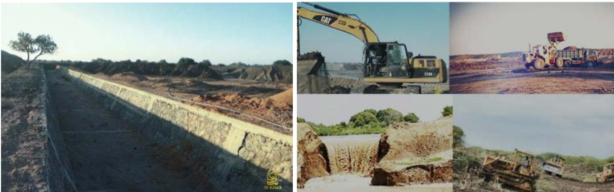
תיעוד מהלך בניית הסכר (סוכנות שהאדה, 5 במאי 2023)

◀ אלכתאא'ב, זרוע ההסברה של אלשבאב, פרסמה ב-5 במאי 2023 תמונות המתעדות בניית סכר במחוז באי (Bay), בדרום סומליה, על-ידי אנשי הארגון (סוכנות הידיעות שהאדה של ארגון אלשבאב, 5 במאי 2023). תמונות אלה יכולות להעיד כי למרות מאמצי ממשלת סומליה וארה"ב לחסל את נוכחות הארגון, יש לו עדיין שליטה באזורים בדרום המדינה.