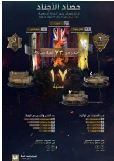
סיכום פיגועי דאעש (שבועון אלנבא', טלגרם, 4 במאי 2023) פיגועים בחתך שבועי (על-פי נתוני הארגון)

ההרוגים והפצועים הגדול ביותר היה במחוז מרכז אפריקה (25). שאר ההרוגים והפצועים: מערב אפריקה (19); מזמביק (17); סוריה (11); עיראק (1) (שבועון אלנבא', טלגרם, 4 במאי 2023).