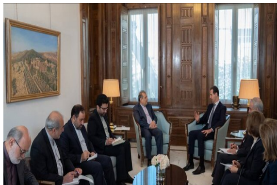
פגישת הנשיא אסד עם עוזר שר החוץ האיראני (איסנ"א, 12 ביוני 2023).

◀ עוזרו הבכיר של שר החוץ האיראני, עלי-אצע'ר ח'אג'י (Ali-Asghar Khaji), נפגש ב-12 ביוני 2023 בדמשק עם נשיא סוריה, בשאר אסד, ודן עימו ביחסים בין שתי המדינות, בהתפתחויות באזור ובהמשך תהליך ההסדרה בסוריה. ח'אג'י הביע את שביעות רצונה של טהראן מההתפתחויות ביחסי החוץ של סוריה, ובכלל זה ההתקרבות בינה לעולם הערבי. הוא ציין, כי אלמלא "ההתנגדות" ומאבקה של סוריה בטרור, לא היה ניתן לממש את השלב הנוכחי בהתפתחויות באזור. במהלך ביקורו בדמשק נפגש עוזר שר החוץ האיראני גם עם אימן סוסאן (Ayman Sousan), סגן שר החוץ הסורי (איסנ"א, 12 ביוני 2023). ב-20 ביוני 2023 התקיים באסטנה בירת קזחסטן מפגש סגני שרי החוץ של רוסיה, סוריה, טורקיה ואיראן במסגרת תהליך ההסדרה (אירנ"א, 20 ביוני 2023).