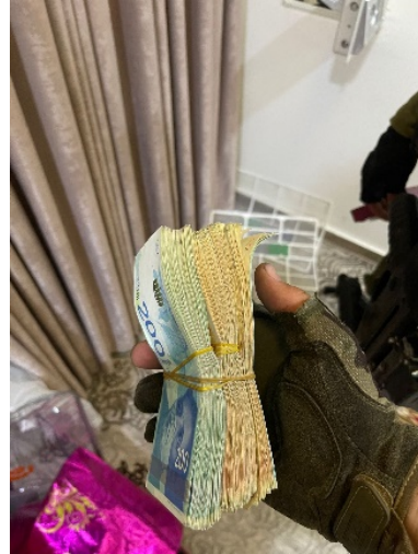
מימין: כספים למימון פעילות טרור. משמאל: ארגזי תחמושת שנתפסו