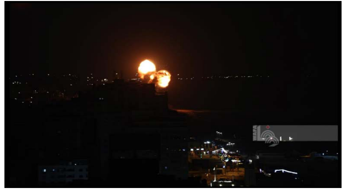
תקיפות חיל האוויר ברצועה (ופא, 5 ביולי 2023)