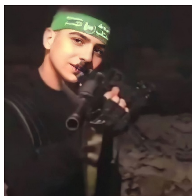
עלי האני אלע'ול (מימין: אתר גדודי אלקסאם, 3 ביולי 2023; משמאל: דף הפייסבוק של אחמד אלע'ול, 3 ביולי 2023)