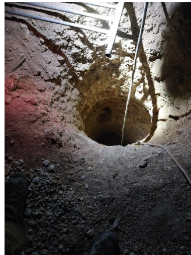
מימין: פיר לאחסון מטעני נפץ (חשבון הטוויטר של דובר צה"ל, 4 ביולי 2023). משמאל: בור תת קרקעי במסגד בו אותרו חומרי נפץ ואמצעי לחימה (חשבון הטוויטר של דובר צה"ל, 3 ביולי 2023)