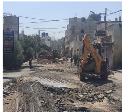
דחפורים של עיריית ג'נין וגופים נוספים פועלים לסילוק ההריסות (ופא, 5 ביולי 2023)

◀ בהתבטאות גורמים פלסטינים צוין המבצע כהישג וניצחון על ישראל וכ"ניצחון ההתנגדות בג'נין". בחמאס ובג'האד האסלאמי בפלסטין ציינו, כי המבצע הבליט פעם נוספת את אחדות הארגונים, יכולות התיאום שלהם ואת אחדות הזירות. להלן תגובות בולטות: