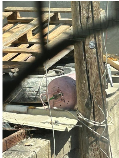
מטעני חומר נפץ שהוטמנו נגד כוחות הביטחון במחנה הפליטים ג'בין

◀ במהלך המבצע נעצרו 300 פלסטינים חשודים בפעילות טרור, מהם שלושים שהיו מבוקשים ע"י כוחות הביטחון. 12 פלסטינים נהרגו, רובם פעילי טרור (ראו פירוט בהמשך). דובר צה"ל ציין שפלסטינים רבים נפצעו מאחר שהמחבלים התחבאו בלב אוכלוסייה אזרחית (דובר צה"ל, 5 ביולי 2023). בכלי התקשורת הפלסטינים גם דווח על אלפי בני אדם שעזבו את מחנה הפליטים.