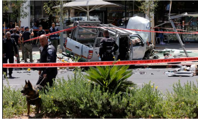
מימין: זירת הפיגוע בתל אביב (אתר ערוץ אלפג'ר, 4 ביולי 2023). משמאל: עבד אלוהאב אלח'לאילה (דף הפייסבוק של עמאד אלעקילי, 4 ביולי 2023)

◀ פיגוע דקירה בבני ברק: ב-3 ביולי 2023, בשעות הערב, הגיע נער פלסטיני לשכונת קריית הרצוג בבני ברק. הוא ניגש לצעיר ישראלי שעבר במקום, שלף סכין והחל לדקור אותו. הצעיר הישראלי הצליח להדוף בידו את הדוקר, נפצע באורח קל ופונה לבית החולים. הדוקר נמלט מהמקום ונתפס זמן קצר לאחר מכן. מבצע הפיגוע הוא נער פלסטיני, בן 14, מג'נין (תקשורת ישראלית, 3 ביולי 2023).