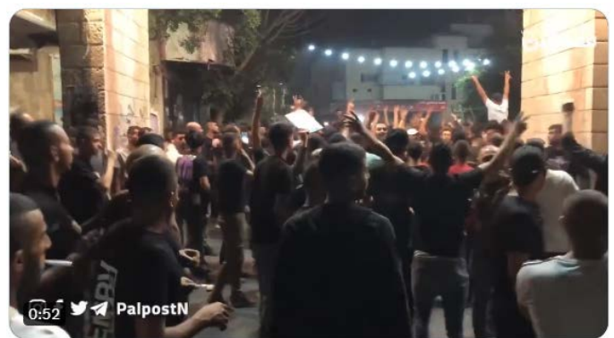
תושבי מחנה חוגגים את יציאת הכוחות (חשבון הטוויטר פלסטין פוסט, 5 ביולי 2023)