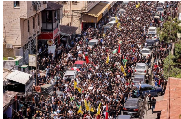
ההלוויה ההמונית (מימין: חשבון הטוויטר Jmedia, משמאל: שהאב, 5 ביולי 2023)