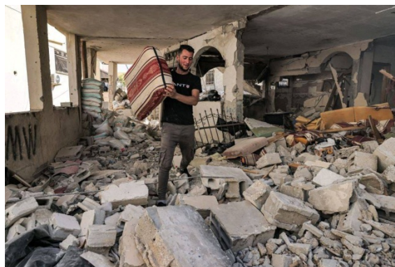
תיעוד ההרס במחנה הפליטים ג'נין