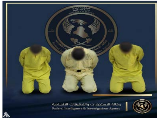
שלושה פעילי דאעש, שנעצרו במחוז נינוא (סוכנות הידיעות העיראקית, 10 ביולי 2023)

◀ ב-10 ביולי 2023 עצרו כוחות ביטחון עיראקיים שלושה פעילי דאעש במחוז נינוא (לא צוין מיקום מדויק) (סוכנות הידיעות העיראקית, 10 ביולי 2023).