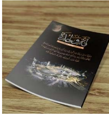
המהדורה העשירית של מגזין אלקאעדה, אמה ואחדה (שבועון אלנבא', טלגרם, 4 ביולי 2023)

◀ המהדורה העשירית של אמה ואחדה, מגזין אלקאעדה, שפורסם ב-6 ביולי 2023, ברך את האומה האסלאמית לרגל חג הקורבן, תאר בהרחבה את הצלחות הארגון מאז הקמתו וביקר בחריפות את ארגון דאעש ואת בית המלוכה הסעודי (טלגרם, 4 ביולי 2023; ממר"י, 6 ביולי 2023).