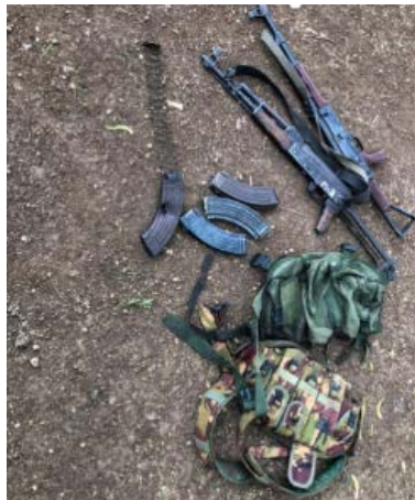
אמצעי הלחימה של פעילי אלשבאב, שאותרו בשבאלה תחתית (סוכנות הידיעות של סומליה, 8 ביולי 2023)

◀ בליל 7 ביולי 2023 ביצעו פעילי אלשבאב סיור באזור בלדמין (Beledamin), בשבאלה תחתית (Lower Shabelle), בדרום סומליה, כהכנה לתקיפה. כוחות האיחוד האפריקאי בסומליה (ATMIS – The African Union Transition Mission), שהציבו מארב במקום, ירו לעברם. שני פעילי אלשבאב נהרגו והשאר נמלטו. שני רובי סער ושש מחסניות אותרו בזירה (סוכנות הידיעות של סומליה, 8 ביולי 2023).