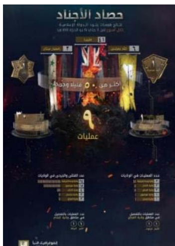
סיכום פיגועי דאעש (שבועון אלנבא', טלגרם, 6 ביולי 2023)