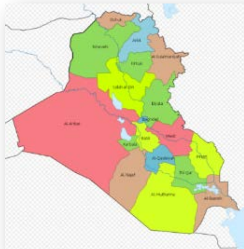
מחוזות עיראק (ויקיפדיה)