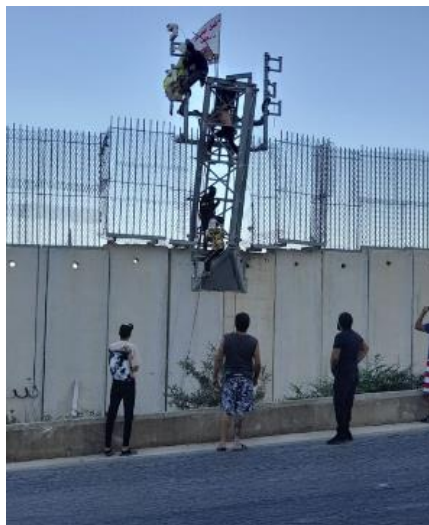
פגיעה במצלמות המעקב שעל הגבול (חשבון הטוויטר @alishoeib1970, 12 ביולי 2023)

◆ מאוחר יותר באותו יום התקרבו מספר חשודים לגדר הביטחון סמוך למטולה, הם יידו אבנים והציתו שריפה סמוך לגדר בשטח לבנון. לוחמי צה"ל ביצעו ירי הרחקה לעברם והם התרחקו מהשטח (דובר צה"ל, 12 ביולי 2023). יתכן ובואם היה על רקע ציון יום השנה ה-17 למלחמת לבנון השנייה. בכלי תקשורת לבנוניים פורסם תיעוד של מספר צעירים לבנוניים מטפסים על גדר הגבול סמוך למטולה ומנסים לכסות את מצלמת האבטחה המוצבת במקום (חשבון הטוויטר, @alishoeib1970, 12 ביולי 2023).