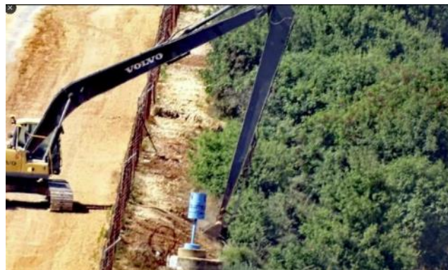
חזבאללה מתעד "הפרה" ישראלית של "הקו הכחול" (חשבון הטוויטר @alishoeib1970, 4 ביולי 2023)

◀ ב-6 ביולי 2023 דווח על פיצוץ סמוך לכפר ע'ג'ר. כוחות צה"ל שהגיעו למקום דיווחו כי מדובר בשיגור פצצות מרגמה שהתפוצצו סמוך לגבול בשטח ישראל. בדיקה מאוחרת העלתה כי מדובר בירי של טיל נ"ט (דובר צה"ל, 6 ביולי 2023). לא ברור מי ביצע את הירי. כלי תקשורת לבנוניים דיווחו על שיגור רקטה מדרום לבנון שנחתה באזור אלוזאני סמוך לכפר ע'ג'ר. "מקורות ביטחוניים" בלבנון טענו כי שוגרה רקטה מאזור כפר שובא (אלנשרה, 6 ביולי 2023). כוחות יוניפי"ל פרסמו הודעה רשמית בה ציינו כי הם לא הצליחו לאשר את מקור הירי ושלחו כוחות לחקור את הנושא. עוד צוין בהודעה כי מפקד יוניפי"ל עומד בקשר עם הרשויות בלבנון ובישראל וצפון כי על הצדדים לנהוג באיפוק ולהימנע מנקיטה בצעדים העלולים להביא למלחמה