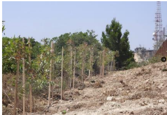
מימין: העצים שנשתלו במקום. משמאל: חיילי צבא לבנון ונציגי יוניפי"ל סמוך לדחפור צה"ל (חשבון הטוויטר @alishoeib1970, 5 ביולי 2023)