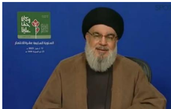
נצראללה נואם (אלמנאר, 12 ביולי 2023)

◆ הפרות ישראליות באזור הגבול: נצראללה ציין כי לפי החלטת 1701 ישראל הייתה אמורה להפסיק פעולות עוינות נגד לבנון ואת המצב המלחמתי תחת פיקוח צבא לבנון ויוניפי"ל, אך בפועל ישראל מפרה את המרחב האווירי של לבנון בשגרה וגם לצורך תקיפות בסוריה וכן את המרחב הימי והיבשתי.