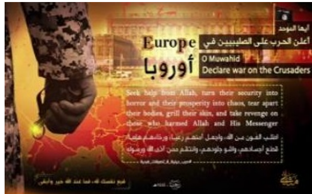
הכרזה המאיימת של דאעש על הנוצרים באירופה (טלגרם, 12 ביולי 2023)

◆ גורם המזוהה עם דאעש פרסם כרזה, באנגלית ובערבית, בה הוא קורא למוסלמים באירופה להילחם ב"צלבנים" (קרי: הנוצרים). הכרזה קוראת למוסלמים לזרוע פחד, כאוס והרג באירופה ו"לנקום במי שהעליב את אללה ושליחו [קרי: הנביא מוחמד]" (טלגרם וממר"י, 12 ביולי 2023).