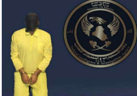
פעיל דאעש, שנעצר במחוז דיאלא (סוכנות הידיעות העיראקית, 12 ביולי 2023)

◀ ב-12 ביולי 2023 עצרו כוחות ביטחון עיראקיים פעיל דאעש במחוז דיאלא (לא צוין מיקום מדויק), שהיה מעורב בהפעלת מטענים ושיגור פצצות מרגמה במרחב הצפון-מערבי של בעקובה (סוכנות הידיעות העיראקית, 12 ביולי 2023).