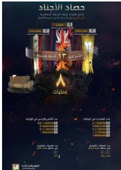
סיכום פיגועי דאעש (שבועון אלנבא', טלגרם, 13 ביולי 2023)