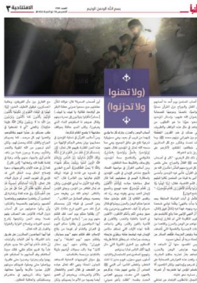
המאמר "אל תיפול רוחכם" (שבועון אלנבא', טלגרם, 13 ביולי 2023)

◀ מאמר המערכת של אלנבא', שבועון דאעש, התפרסם השבוע תחת הכותרת "אל תיפול רוחכם!". כותב המאמר ניסה לעודד את רוחם של פעילי הארגון לאור הירידה בפעילות הארגון. הוא מציין כי פסוקי הקוראן ירדו אל נביא האסלאם, מחמד, דווקא בזמנים קשים, וכי הם נועדו לעודד את רוחם. כך גם על פעילי הארגון להתעודד ולעמוד איתן עד לניצחון, שלטענתו, צפוי להגיע (שבועון אלנבא', טלגרם, 13 ביולי 2023).