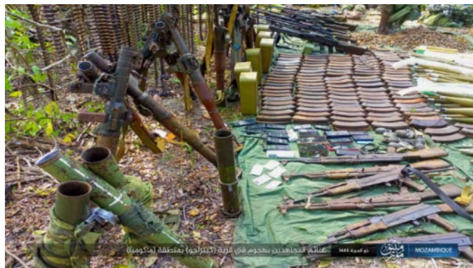
אמצעי לחימה של צבא מוזמביק, שנלקחו על-ידי דאעש (טלגרם, 12 ביולי 2023)