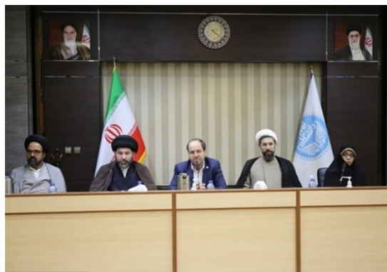
משלחת עיראקית באוניברסיטת טהראן (תסנים, 8 ביולי 2023)