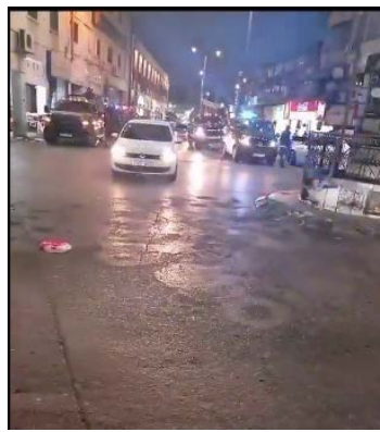
כלי רכב של מנגנוני הביטחון הפלסטיניים פרוסים בג'נין (מימין: חשבון הטוויטר של שהאב, 17 ביולי 2023; משמאל: דף הפייסבוק קבאטיה מכס, 17 ביולי 2023)

◀ חמאס גינתה בחריפות את מדיניות המעצרים הפוליטיים במיוחד בתקופה בה הפלסטינים עסוקים בעימותים נגד ישראל. חמאס הדגישה כי זוהי "התנהגות פחדנית הראויה לגינוי", שמאיימת על שלום החברה ופותרת פתח למלחמת אחים (פתנה), שהפלסטינים אינם זקוקים לה עתה. חמאס קראה לרשות להפסיק את מדיניות התיאום הביטחוני עם ישראל והמעצרים הפוליטיים, ולשחרר לאלתר את כל העצורים (אתר חמאס, 11 ביולי 2023). חסאם בדראן, חבר הלשכה המדינית של חמאס , אמר כי המעצרים, שגברו בתקופה האחרונה, כללו מקרים רבים של עינויים קשים וחקירה על רקע פעילות פוליטית. הוא הדגיש כי על מנגנוני הביטחון להפסיק את המעצרים ולשחרר את כל העצורים הפוליטיים, כדי שחמאס ושאר הארגונים בעזה יוכלו לפעול להצלחת יוזמת אבו מאזן (אתר independentarabia, 13 ביולי 2023).