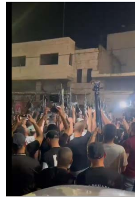
ההפגנה במחנה הפליטים ג'נין (מימין: חשבון הטוויטר של צפא, 17 ביולי 2023; משמאל: דף הפייסבוק של הצלם והאג' בני מפלח, 17 ביולי 2023)