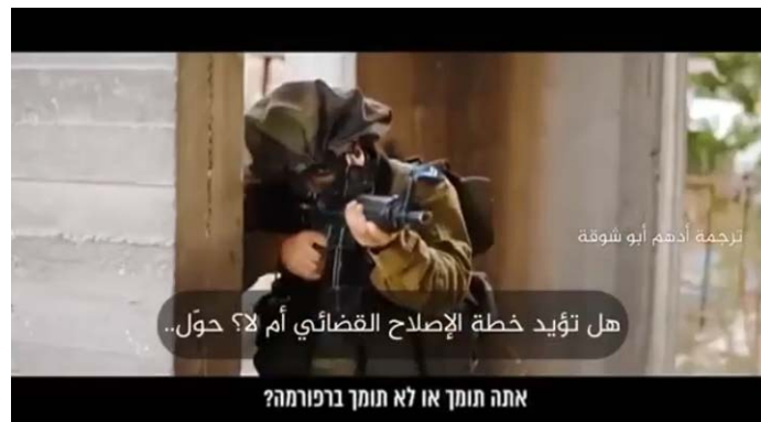
סצנה מתוך הסרטון הישראלי עם תרגום לערבית (אלמנאר, 24 ביולי 2023)

◀ באתר אלמנאר פורסם סרטון קצר שהופץ קודם ברשתות החברתיות בישראל (כולל כתוביות ערבית בגרסת אלמנאר) המדמה מצב, בו חייל בכוח קרקעי של צה"ל מבקש סיוע אווירי וטייס חיל האוויר מבקש לדעת האם החייל תומך או לא תומך בחקיקה המתוכננת, כתנאי למתן סיוע (אלמנאר, 24 ביולי 2023). בכתבה אחרת באתר אלמנאר פורסמה כתבה המסתמכת בעיקר על דיווחי התקשורת הישראלית ולפיה המחלוקת הפוליטית בישראל מחלחלת לשורות הצבא ומשפיעה על הנכונות להתייבב לשירות מילואים (אלמנאר, 25 ביולי 2023).