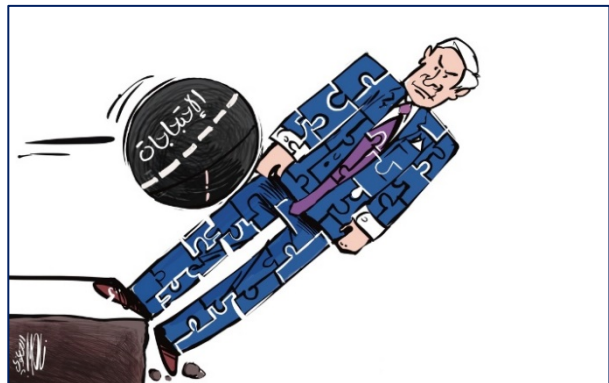
קריקטורות ביומון "אלקדס". מימין: נתניהו מופל ע"י משקולת/כדור עם הכיתוב "המחאות" (אלקדס, 9 ביולי 2023). משמאל: קריקטורה נוספת המתארת את מצבו של נתניהו (אלקדס, 13 ביולי 2023)