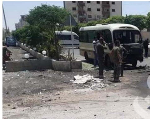
מימין: זירת הפיגוע (אח'באר אלשיעה, 25 ביולי 2023). משמאל: האוטובוס שנפגע (חשבון הטוויטר @FA6969Di, 25 ביולי 2023)

◆ ב-27 ביולי 2023 הופעל אופנוע נפץ בסמוך למונית ברחוב כוע סודאן, מול מלון סידת אלשא'ם. ששה בני אדם נהרגו ו-23 נפצעו (סאנא, 27 ביולי 2023). יומיים לאחר מכן, דווח כי מספר ההרוגים עלה לעשרה. בין ההרוגים חמישה ילדים, אישה, גבר, איש כוחות ביטחון ושני בני אדם שאינם סורים (מרכז המעקב הסורי לזכויות אדם, 29 ביולי 2023).