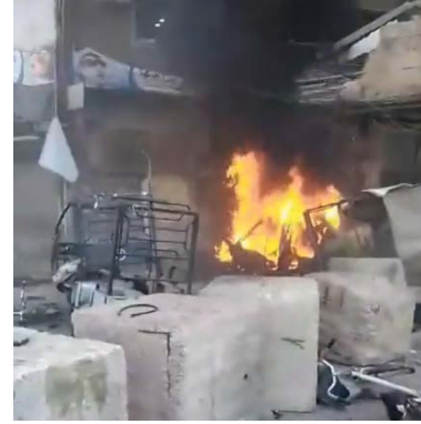
מימין: זירת הפיגוע (27 ביולי 2023). משמאל: שרידי כלי הרכב (27 ביולי 2023)

◀ דאעש פרסם, ב-28 ביולי 2023 הודעה בה קיבל אחריות על ביצוע שני הפיגועים באלסידה זינב בהם, לטענתו, הופעל אופנוע נפץ סמוך לאוטובוס שהסיע עולי רגל שיעים וסמוך למונית. בסיום ההודעה איים דאעש "שיידעו הסרבנים [הכוונה לשיעים] שמלחמתנו נגדם נמשכת בכל מקום" (טלגרם, אעמאק, 28 ביולי 2023).