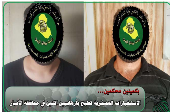
שני פעילי דאעש, שנעצרו במחוז אלאנבאר (דף הפייסבוק SecMedCell, 28 ביולי 2023)

ב-28 ביולי 2023 עצר כוח של המודיעין הצבאי העיראקי שני פעילי דאעש (לא צוין מיקום מדויק) (דף הפייסבוק SecMedCell, 28 ביולי 2023).