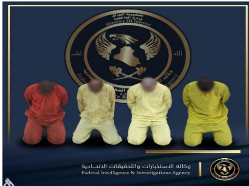
ארבעת פעילי דאעש, שנעצרו במחוז נינוא (סוכנות הידיעות העיראקית, 27 ביולי 2023)

ב-27 ביולי 2023 עצר כוח של סוכנות המודיעין והחקירות הפדרלית ארבעה פעילי דאעש (לא צוין מיקום מדויק). הארבעה הודו בהשתייכותם לארגון ובפעילות במסגרות שונות שלו (סוכנות הידיעות העיראקית, 27 ביולי 2023).