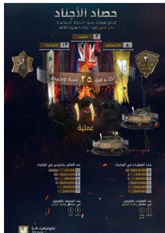
סיכום פיגועי דאעש (שבועון אלנבא', טלגרם, 27 ביולי 2023)

◀ מנתוני אינפוגרף, שפרסם אלנבא', שבועון דאעש, המסכם את פעילות דאעש בתקופה שבין 20-26 ביולי 2023, עולה כי בתקופה זו ביצעו פעילי הארגון 11 פיגועים במחוזות השונים (לעומת 18 בשבוע שקדם). מספר הפיגועים הגבוה ביותר בוצע על-ידי פעילי מחוז מערב אפריקה (4). בשאר המחוזות: סוריה (2); עיראק (2); מרכז אפריקה (1); פקיסטאן (1); סומליה (1). בפיגועים נהרגו ונפצעו 25 בני אדם, לעומת 37 בני-אדם בשבוע שקדם. מספר ההרוגים והפצועים הגדול ביותר היה במחוז סוריה (11). בשאר המחוזות: מערב אפריקה (5); עיראק (4); מרכז אפריקה (3); פקיסטאן (1); סומליה (1) (שבועון אלנבא', טלגרם, 27 ביולי 2023). מדובר בירידה מתונה בפעילות דאעש ברחבי העולם.