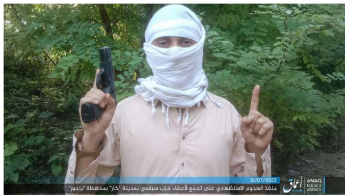
המחבל, שביצע את פיגוע ההתאבדות (אעמאק, טלגרם, 31 ביולי 2023)