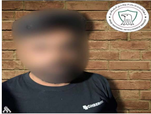
מפקד דאעש שנעצר בבגדאד (סוכנות הידיעות העיראקית, 28 ביולי 2023)