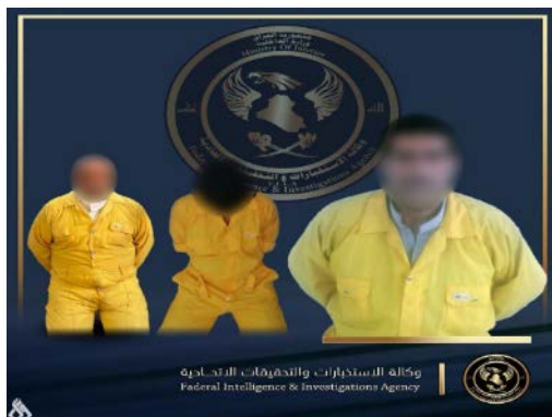
שלושת פעילי דאעש שנעצרו בבגדאד