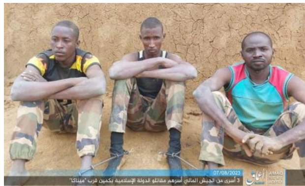
שלושת חיילי צבא מאלי החטופים (טלגרם, 7 באוגוסט 2023)

◀ ב-3 באוגוסט 2023 הותקפה ממארב שיירת משאיות, באזור הגבול בין מאלי לניז'ר, לא הרחק מהעיר מנאקה (Menaka), שבדרום-מזרח המדינה. במקום התנהלו חילופי אש כבדים בין כוחות משמר הגבול לבין פעילי דאעש. לא ידוע כמה נפגעים היו באירוע. על-פי אחת הגרסאות שלא אומתה, המשאיות שהותקפו העבירו אמצעי לחימה (אלשרק אלאוסט, 4 באוגוסט 2023). דאעש קיבל אחריות ביצוע התקיפה וציין בהודעה שפרסם, כי פעיליו תקפו ממארב שיירה צבאית וכי 13 חיילים נהרגו ושלושה נוספים נחטפו (טלגרם, 7 באוגוסט 2023).