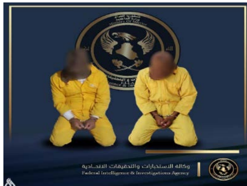
שני פעילי דאעש, שנעצרו במחוז כרכוכ (סוכנות הידיעות העיראקית, 7 באוגוסט 2023)

ב-7 באוגוסט 2023 עצרו כוחות ביטחון עיראקיים שני פעילי דאעש (לא צוין מיקום מדויק). השניים הודו בהשתייכות לארגון ובפעילות במסגרות שונות שלו. אחד מהם היה אחראי במשטרת המוסר (אלחסבה) ובמסגרת תפקידו היה אחראי להטמנת מטענים והפעלתם בבתיהם של אנשי כוחות ביטחון עיראקיים. השני נטל חלק בלחימה נגד כוחות הפשמרגה הכורדים (סוכנות הידיעות העיראקית, 7 באוגוסט 2023).