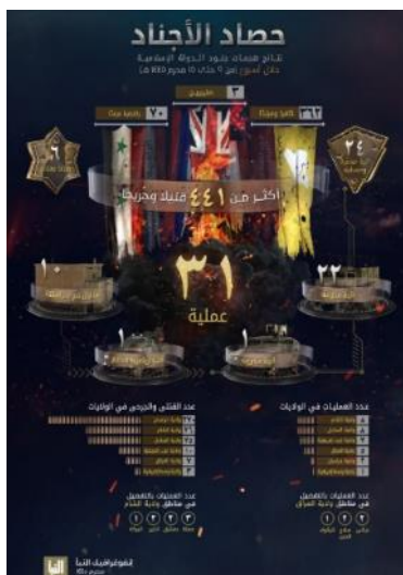
סיכום פיגועי דאעש (שבועון אלנבא', טלגרם, 3 באוגוסט 2023)

◀ מנתוני אינפוגרף, שפרסם אלנבא', שבועון דאעש, המסכם את פעילות דאעש בתקופה שבין 27 ביולי - 2 באוגוסט 2023, עולה כי בתקופה זו ביצעו פעילי הארגון 31 פיגועים במחוזות השונים (לעומת 11 בשבוע שקדם). מספר הפיגועים הגבוה ביותר בוצע על-ידי פעילי המחוזות סוריה ואלסאחל (8 בכל אחד אחד). בשאר המחוזות: מערב אפריקה (7); עיראק (5); ח'ראסאן (אפגניסטאן ופקיסטאן) (2); מרכז אפריקה (1). בפיגועים נהרגו ונפצעו 441 בני אדם, לעומת 25 בני-אדם בשבוע שקדם. מספר הנפגעים הגדול ביותר היה במחוז ח'ראסאן (אפגניסטאן ופקיסטאן) (270). בשאר המחוזות: סוריה (76); אלסאחל (75); מערב אפריקה (10); עיראק (7); מרכז אפריקה (3) (שבועון אלנבא', טלגרם, 3 באוגוסט 2023). על פי הנתונים, מדובר בעלייה בפעילות דאעש ברחבי העולם. העלייה המשמעותית במספר הנפגעים הינה בשל פיגוע ההתאבדות שבוצע בפקיסטאן ב-30 ביולי 2023 בו נהרגו 250 בני אדם. 2