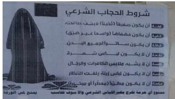
אחד הכרוזים שתלו פעילי דאעש (Ugarit Post, 6 באוגוסט 2023)

◀ ב-6 באוגוסט 2023 תלו פעילי דאעש כרוזים על מספר בתים בעיירה אלטייאנה (Al-Tayyana), כשבעה ק"מ מדרום-מזרח לאלמיאדין, בהם איימו להוציא להורג נשים בעיירה, במידה והן לא תקפדנה על "לבוש شرעי" (לבוש המכסה את כל הגוף, כולל הפנים וכפות הידיים) (מרכז המעקב הסורי לזכויות אדם, 6 באוגוסט 2023). מדובר בניסיון של דאעש להשליט את כוחו באזור.