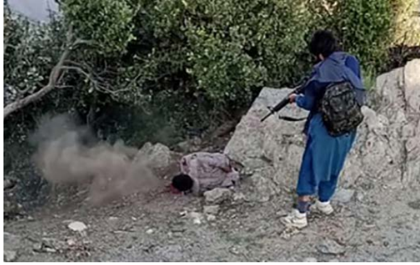
פעיל דאעש יורה למוות ב"מרגל" (שבועון אלנבא', טלגרם, 3 באוגוסט 2023)