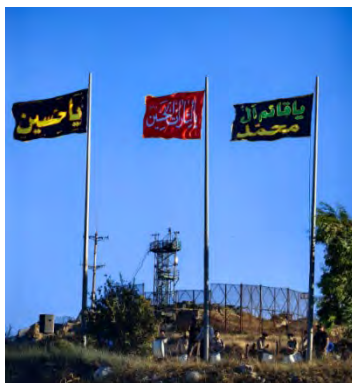
דגלים בעלי סממנים שיעיים שהונפו מול מוצב צה"ל (חשבון הטוויטר של עלי שעיב, 4 באוגוסט 2023)