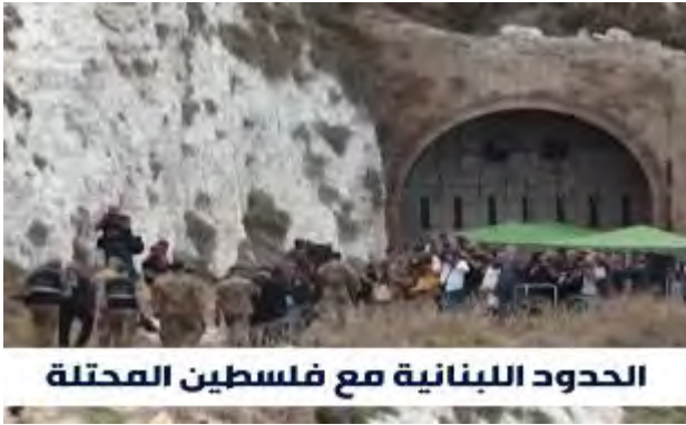
الحدود اللبنانية مع فلسطين المحتلة