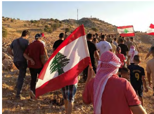
תהלוכת תושבי כפר שובא