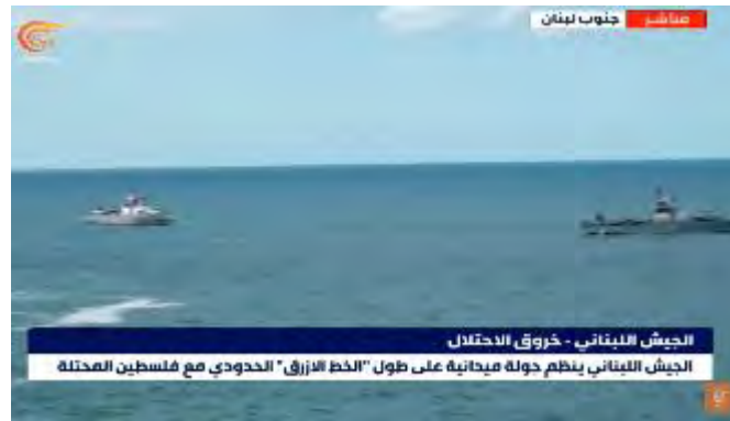
الجيش اللبناني - خروج الاحتلال الجيش اللبناني ينظم جولة ميدانية على طول "الخط الأزرق" الحدودي مع فلسطين المحتلة

◀ דווח כי בתחילת הסיור העלה צבא לבנון את כוננות כוחותיו הימיים מול ספינות צה"ל באזור אלנאקורה, בטענה שהן חדרו כעשרים מטרים למים הטריטוריאליים של לבנון והפרו בכך את ריבונות לבנון. ערוץ אלמיאדין ציין כי הם תעדו את האירוע (אלמיאדין, 8 באוגוסט 2023).