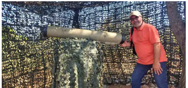
סיור העיתונאים לאורך גבול ישראל לבנון: מימין: אחד העיתונאים מצטלם ליד טיל קורנט. משמאל: אחד העיתונאים צופה לשטח ישראל (אתר לבנון 24, 6 באוגוסט 2023)