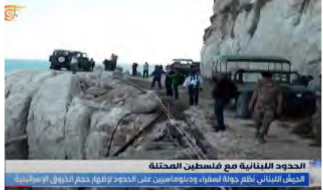
الحدود اللبنانية مع فلسطين المحتلة الجيش اللبناني نظم جولة لسفراء ودبلوماسيين على الحدود لإظهار حجم التهريب الإسرائيلي