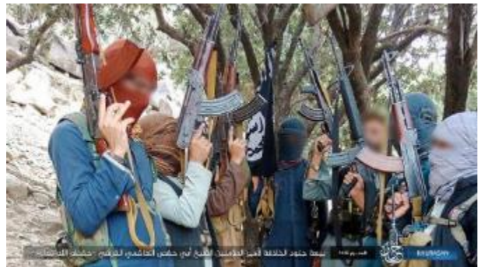
פעילי מחוז ח'ראסאן ופעילי מחוז אלשאם של דאעש נשבעים אמונים למנהיג החדש של הארגון (טלגרם, 12 באוגוסט 2023)