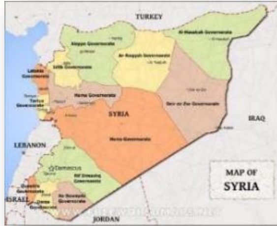
מחוזות סוריה (Free world maps)