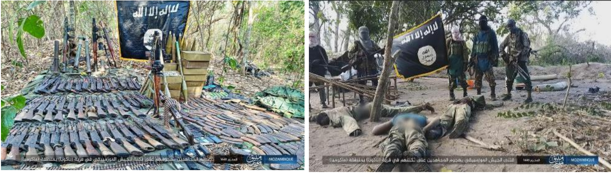
פעילי דאעש לצד גופות של חיילים מצבא מוזמביק ואמל"ח שנתפס (טלגרם, 11 באוגוסט 2023)