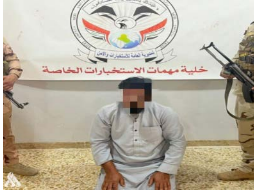
אחראי התא של דאעש, שנעצר במחוז צלאח אלדין (סוכנות הידיעות העיראקית, 11 באוגוסט 2023)

◀ ב-11 באוגוסט 2023 עצרו כוחות הביטחון העיראקים פעיל דאעש מבוקש בנפת אלשרקאט (Al-Shirqat), כמאה ק"מ ממערב לכרכוכ, לאחר שהוא נמלט אליה ממחוז נינוא. הפעיל היה אחראי תא של פעילי הארגון (סוכנות הידיעות העיראקית, 11 באוגוסט 2023).