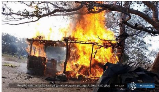
המתחם של צבא מוזמביק עולה באש (טלגרם, 11 באוגוסט 2023)