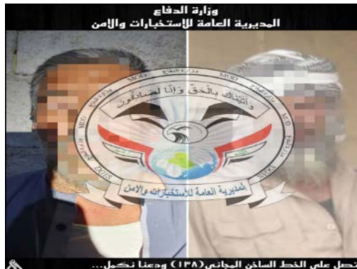
אחראי סדנת החבלה של דאעש, שנעצר במחוז כרכוכ (סוכנות הידיעות העיראקית, 12 באוגוסט 2023)

◀ ב-12 באוגוסט 2023 עצרו כוחות הביטחון העיראקים מפקד בכיר של דאעש במחוז כרכוכ, שהיה אחראי על סדנה למיגון כלי רכב, הכנת רכבי תופת ומטענים של הארגון (סוכנות הידיעות העיראקית, 12 באוגוסט 2023).