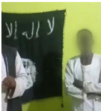
פעילי דאעש בסודאן נשבעים אמונים למנהיג החדש של הארגון (טלגרם, 13 באוגוסט 2023)