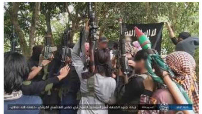
פעילי מחוז מזרח אסיה ופעילי מחוז מוזמביק של דאעש נשבעים אמונים למנהיג החדש של הארגון (טלגרם, 14-12 באוגוסט 2023)