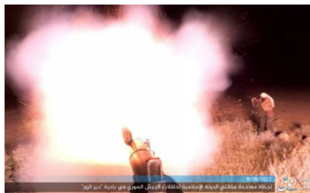
מימין: תקיפת האוטובוס. משמאל: האוטובוס עולה באש (11 ו-14 באוגוסט 2023)