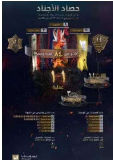
סיכום פיגועי דאעש (שבועון אלנבא', טלגרם, 10 באוגוסט 2023)