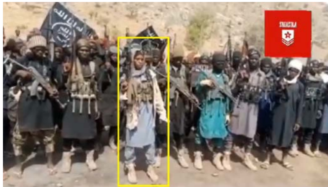
פעיל בוקו חראם (בצהוב) במהלך השמעת האיום בהגברת הפיגועים (Zagazola, 13 באוגוסט 2023)

◀ ב-13 באוגוסט 2023 פורסם סרטון של פעילי בוקו חראם, הפועלים בהרי מנדארה (Mandara Mountains), שבצפון קמרון ולאורך חלק מהגבול עם ניגריה, בו איים הדובר, כשמאחוריו עשרות פעילים חמושים, להגביר את הפיגועים באמצעות מטענים ומתאבדים נגד הממשל הניגרי ואזרחיו. בנוסף לכך, הושמע איום לפגוע בלוחמי המיליציה המקומית (CJTF – The Civilian Joint Task Force), הפועלים יחד עם צבא ניגריה למיגור פעילות הארגון (Zagazola, 13 באוגוסט 2023).