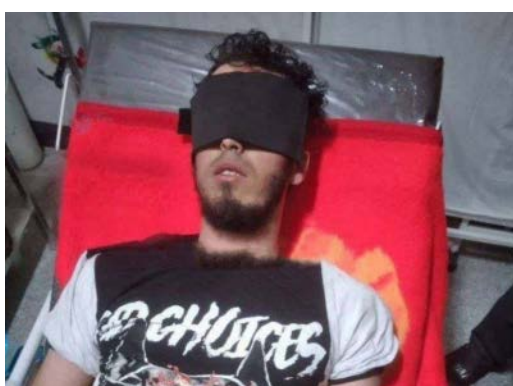
מבצע הפיגוע במקדש שאה-א צ'ראע' בשיראז (תסנים, 14 באוגוסט 2023)