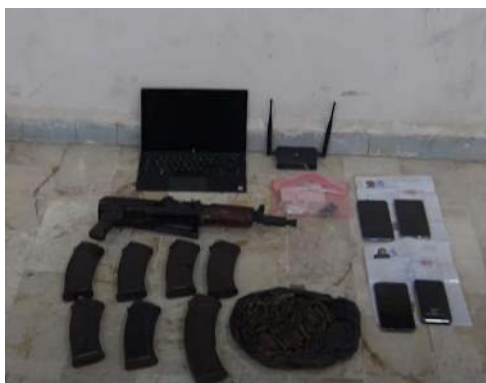
נשק, תחמושת ומחשב אישי שנתפסו במהלך המבצע (PRESS SDF, 17 באוגוסט 2023)