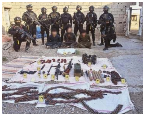
שלושת העצורים ואמצעי הלחימה שנתפסו (שפק ניז, 16 באוגוסט 2023)

◀ ב-16 באוגוסט 2023 עצרו כוחות ביטחון עיראקים שלושה סוחרי סמים הקשורים לדאעש באזור ח'אנקין, כמאה ק"מ צפונית מזרחית לבעקובה. ברשות השלושה נמצאו אמצעי לחימה ביניהם רובים, מטענים ותחמושת (שפק ניז, 16 באוגוסט 2023).