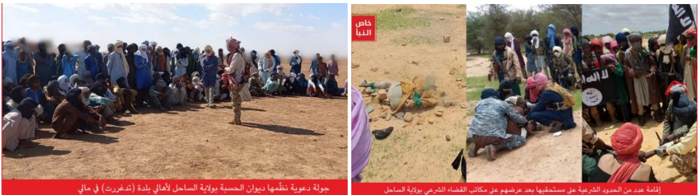
מימין: תיעוד סקילה באבנים. משמאל: פעילות תעמולה בקרב התושבים (שבועון אלנבא', טלגרם, 24 באוגוסט 2023).

◀ בכתבה שפורסמה בגיליון האחרון של אלנבא', שבועון דאעש, צוין כי הארגון הגדיל את פעילות המשילות שלו במאלי ונראה כי השפעתו במדינה גוברת. במסגרת זאת הרחיב הארגון את פעילות לשכת החסבה (דיואן אלחסבה, לשכה האמונה על החלת חוקי ההלכה האסלאמית, השריעה, ופועלת כמשטרה אסלאמית). לכתבה צורפו תמונות המתעדות סקילה של אדם שעבר על חוקי ההלכה האסלאמית, על-פי הפרשנות הנוקשה שבה דוגל הארגון. במקביל פועל הארגון בקרב התושבים במישור התעמולתי (שבועון אלנבא', טלגרם, 24 באוגוסט 2023)..