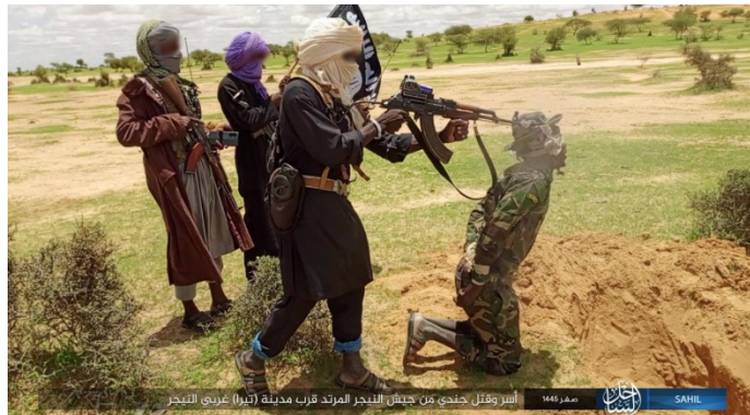
הוצאה להורג של חייל צבא ניז'ר (טלגרם, 29 באוגוסט 2023)

◀ ב-29 באוגוסט 2023 פרסם מחוז אלסאחל של דאעש תמונות המתעדות הוצאה להורג של חייל צבא ניז'ר שלדבריהם, נחטף בעיר טירה, במערב המדינה (טלגרם, 29 באוגוסט 2023).