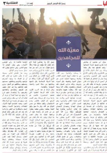
המאמר "אללה נמצא עם לוחמי הג'האד" (שבועון אלנבא', טלגרם, 24 באוגוסט 2023)

אלנבא', טלגרם, 24 באוגוסט 2023). המאמר נועד לעודד את פעילי הארגון להמשיך לפעול ולחזק את מגמת ההתאוששות של הארגון שניכרת לאחרונה, לאחר תקופה של ירידה בהיקף פעילותו.