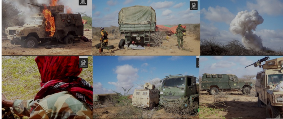
תיעוד המתקפות נגד בסיסי צבא סומליה והמיליציות המסייעות לו במרכז המדינה (סוכנות שהאדה, 26 באוגוסט 2023)

במרכז המדינה. לטענת הארגון, בפעולה נהרגו 178 חיילים. חיילים נוספים (לא נמסר מספר מדויק), נפלו בשבי ומאות חיילים נמלטו (סוכנות שהאדה, 26 באוגוסט 2023). חיילים ומקורות רפואיים דיווחו שמספר ההרוגים לא ידוע וכי בנוסף ישנם עשרות פצועים (רויטרס, 28 באוגוסט 2023). סוכנות אלשהאדה, זרוע ההסברה של אלשבאב, הודיעה כי בעקבות תקיפת שלושת הבסיסים, הצליחו פעילי הארגון השתלט מחדש על מספר ערים ועיירות בסביבה (סוכנות שהאדה, 29 באוגוסט 2023).