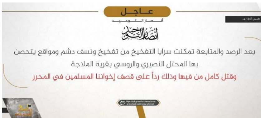
הודעת קבלת האחריות של אנצאר אלתוחיד (טלגרם, 26 באוגוסט 2023)

◀ ב-29 באוגוסט 2023 ניסה כוח של צבא סוריה, בפיקוד אנשי חזבאללה, לחדור לחלק הצפוני של מובלעת המורדים באדלב. כוח של המטה לשחרור אלשאם, הארגון הדומיננטי בשטח, המזוהה עם אלקאעדה, זיהה את הכוח ותקף אותו. שני חיילים נהרגו ולפחות שישה נפצעו (מרכז המעקב הסורי לזכויות אדם, 29 באוגוסט 2023). ◀ ב-26 באוגוסט 2023 דווח על פיצוץ מנהרת נפץ שהתוואי שלה עבר תחת עמדות צבא סוריה בכפר אלמלאג'ה (al-Milaja), כארבעים ק"מ דרומית-מערבית לאדלב. לפחות 11 חיילים נהרגו ועשרים נוספים נפצעו. על-פי הדיווחים, ככל הנראה שני ארגונים המשתייכים לקואליציית ארגוני האופוזיציה הסורית באדלב, עומדים מאחורי האירוע: אנצאר אלתוחיד ואלחזב אלאסלאמי אלתרכסתאני (המפלגה האסלאמית של תורכסטאן), (מרכז המעקב הסורי לזכויות אדם, 26 באוגוסט 2023; ARAB NEWS, 27 באוגוסט 2023). ◀ ארגון אנצאר אלתוחיד פרסם הודעת קבלת אחריות וציין כי פעיליו מילכדו את עמדות צבא סוריה ורוסיה בכפר אלמלאג'ה וכי הם הרגו את כל מי שנמצא בהן. הארגון ציין כי הפעולה בוצעה בתגובה לתקיפות צבא סוריה ורוסיה נגד תושבי מובלעת המורדים באדלב (טלגרם, 26 באוגוסט 2023).