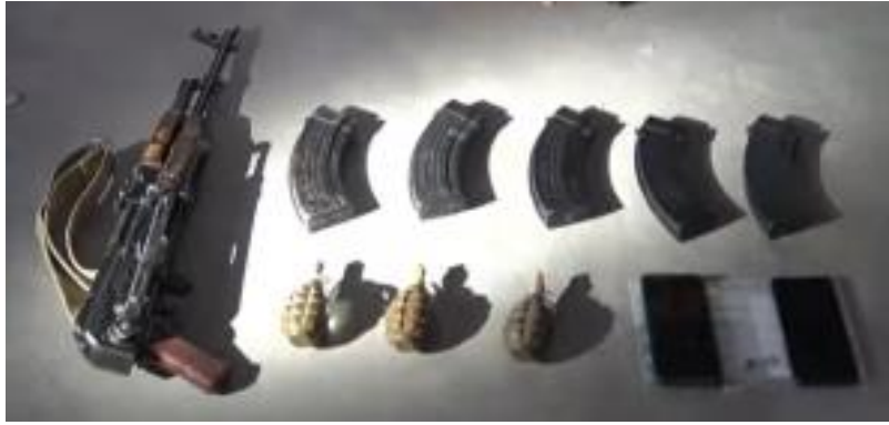
אמצעי הלחימה והטלפונים שנתפסו ברשות סייען דאעש (SDF PRESS, 2 בספטמבר 2023)