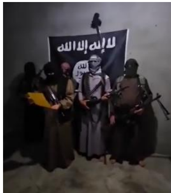
איום דאעש בתקיפת מחנה אלהול ( חשבון הטוויטר @Orhan_Qereman, 3 בספטמבר 2023)

◀ 94 בני משפחות פעילי דאעש הושבו ממחנה אלהול (כ-35 ק"מ מדרום-מזרח לאלחסכה), בו עצורים עשרות אלפי בני משפחות פעילי דאעש, לעיר מוצאם, אלרקה. חזרתם בוצעה לאחר תיאום שנעשה בין הכוחות הכורדים לבין ראשי השבטים באזור. צעד זה נועד לפנות בהדרגה את מחנה אלהול מיושביו. זאת, בשל קשיי הכוחות הכורדים לנהל את המקום ולאבטח אותו (מרכז המעקב הסורי לזכויות אדם, 3 בספטמבר 2023). ◀ בהקשר זה, דווח כי דאעש חוזר ומאיים לתקוף את המחנה, במטרה לשחרר את פעיליו ובני משפחותיהם. בסרטון שהופץ ברשתות החברתיות ב-3 בספטמבר 2023, איים תא של הארגון באזור דיר אלזור כי הארגון יתקוף את מחנה אלהול. הדובר בסרטון איים גם להרוג אנשי המשטר הסורי וכוחות SDF הכורדים (חשבון הטוויטר @Orhan_Qereman, 3 בספטמבר 2023).