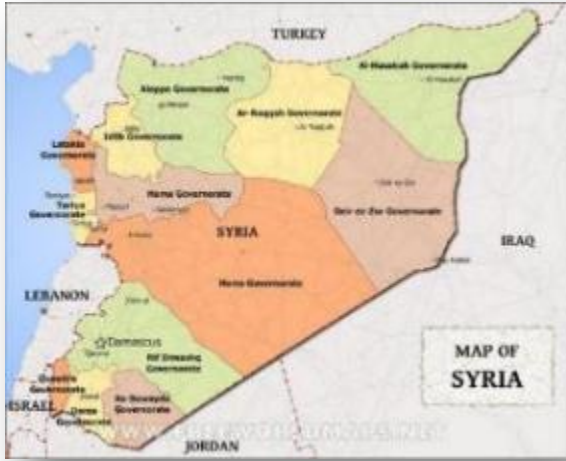
מחוזות סוריה (Free world maps)