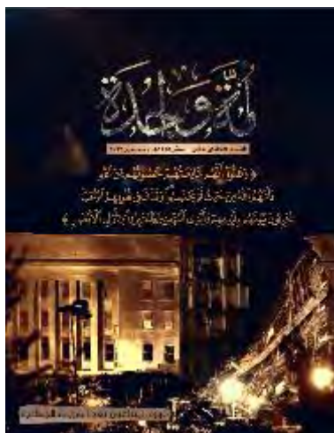
המגזין אמה ואחדה (טלגרם, 11 בספטמבר 2023)

◀ ב-11 בספטמבר 2023 פרסם ארגון אלקאעדה מהדורה נוספת של המגזין אמה ואחדה (אומה אחת), המוקדשת לאירועי 11 בספטמבר 2001. במגזין צוין שלפיגועים הייתה השפעה אסטרטגית עצומה, אך בו-זמנית הוא טוען כי אין צורך לחזור על הפיגוע, שכן "המכה האסלאמית הבאה" חייבת להיות הרבה יותר מתוחכמת ולא צפויה, שהשפעתה תהדהד בעוצמה. עוד צוין כי "המכה האסלאמית הבאה" לא תהיה בהכרח בארצות-הברית, אבל השפעותיה צריכות להיות מעל ומעבר לאירועי 11 בספטמבר 2001 (טלגרם, 11 בספטמבר 2023).