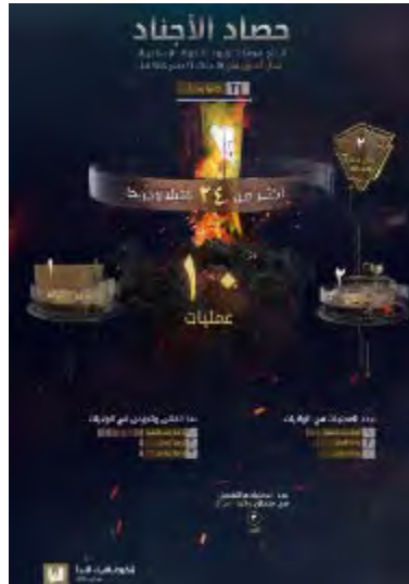
סיכום פיגועי דאעש (שבועון אלנבא', טלגרם, 7 בספטמבר 2023)