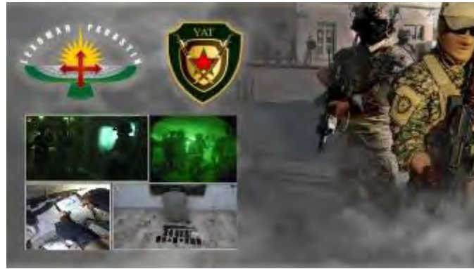
נשק ומסמכים שאותרו ותיעוד מהמבצע של כוחות SDF הכורדים בשיתוף הקואליציה הבינלאומית (8 בספטמבר 2023)