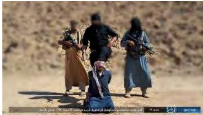
אחד "המרגלים" רגע לפני הוצאתו להורג (טלגרם, 11 בספטמבר 2023)

◀ ב-11 בספטמבר 2023 הודיע דאעש כי הוציא להורג שני "מרגלים" שפעלו למען ממשלת עיראק באזור אלכביסה, במערב עיראק. הארגון פרסם צילומים המתעדים את ההוצאה להורג (טלגרם, 11 בספטמבר 2023).