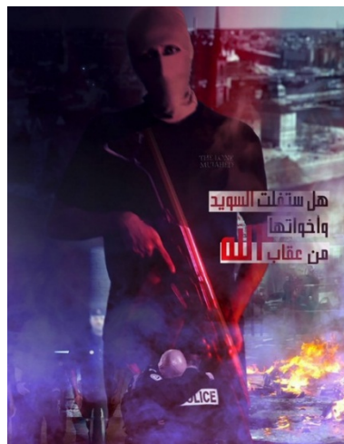
כרזת האיום על שבדיה ו"אחיותיה" (טלגרם, 19 בספטמבר 2023)

ב-19 בספטמבר 2023 פרסם גורם המזוהה עם אלקאעדה כרזה, בה איים על שבדיה ו"אחיותיה", כלומר מדינות אירופה המזדהות עימה. בכרזה נראה פעיל חמוש רעול פנים תחת הכיתוב "האם שבדיה ואחיותיה יתחמקו מעונשו של אלה?". הכרזה התפרסמה על רקע אישור שנתנו שלטונות שבדיה להעלות באש עותקים של הקוראן בטענה שהאקט עולה בקנה אחד עם ערכי חופש הביטוי (טלגרם, 19 בספטמבר 2023).