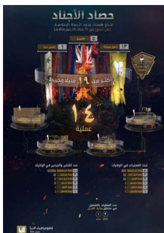
סיכום פיגועי דאעש (שבועון אלנבא', סלגרם, 14 בספטמבר 2023)