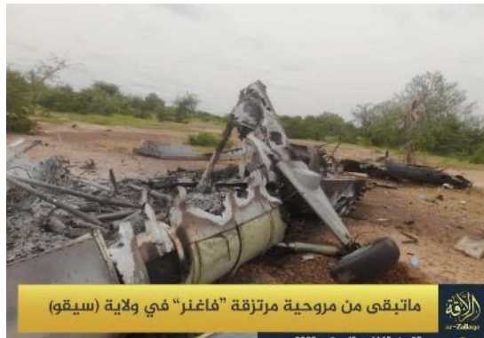
שרידי המסוק לאחר שהוצת על-ידי לוחמי כוח ואגנר (טלגרם, 13 בספטמבר 2023)

◆ ב-8 וב-9 בספטמבר 2023 בוצעו תקיפות ממארב נגד מסוק של לוחמי כוח ואגנר במחוז סיקסו (Sikasso), בדרום המדינה. המסוק הופל ואנשיו נהרגו. לאחר הפלת המסוק התנהלו חיילי אש בין הצדדים. לוחמים נוספים נפגעו ומסוק נוסף הושבת. לטענת הארגון, לוחמי כוח ואגנר הפעילו מטען והציתו את המסוק המושבת אך הם הצליחו באופן חלקי בלבד (טלגרם, 13 בספטמבר 2023).