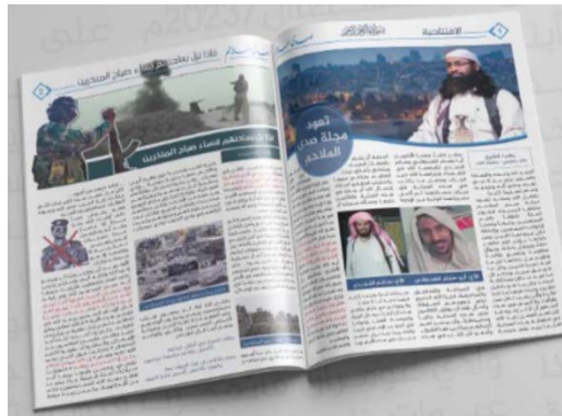
המגזין צדא אלמלאחם של אלקאעדה (חשבון הטוויטר של Elisabeth Kendall@Dr_E_Kendall, 15 בספטמבר 2023)

ב-15 בספטמבר 2023 פרסם ארגון אלקאעדה בחצי האי ערב (AQAP) את גיליון 17 של המגזין צדא אלמלאחם, 3 לאחר 12 שנה, בהן לא הופץ המגזין. הגיליון הנוכחי התמקד בפעילות הארגון והצהרות מנהיגיו (חשבון הטוויטר של Elisabeth Kendall@Dr_E_Kendall, 15 בספטמבר 2023). להערכתנו, הפרסום יכול להעיד על רצון הארגון לחדש את פעילות ההסברה שלו, זאת כדי לגייס תמיכה ופעילים. יש לציין כי גיליון 1-16 של מגזין זה פורסמו בין השנים 2008-2011