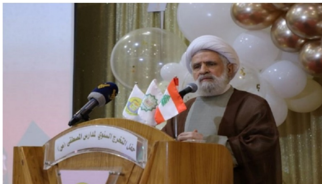
נעים קאסם, סמזכ"ל חזבאללה (אלמנאר, 16 בספטמבר 2023)

◀ בנאום שנשא נעים קאסם, סגן מזכ"ל חזבאללה , בטקס סיום בתי הספר של חזבאללה בביירות, ציין כי תמה התקופה שישראל הייתה יכולה לפגוע בחיי לבנונים ללא תגובה. הוא הדגיש שכל מי שמטיח האשמות בחזבאללה בקשר לכוח הצבאי שלו מנסה להסתיר את חולשתו הפוליטית בבחירות לנשיאות. קאסם גם תקף את כל מי שתובע לפרק את חזבאללה מנשקו בציינו כי בכך הוא פותח את דלתה של לבנון בפני תוקפנות ישראל (אלמנאר, 16 בספטמבר 2023).