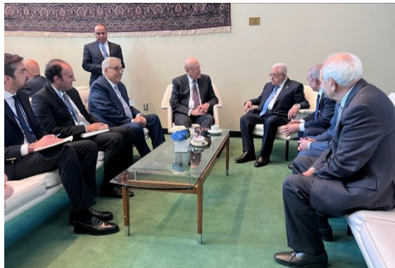
אבו מאזן בפגישה עם נגיב מיקאטי (ופא, 19 בספטמבר 2023)

◀ בשולי העצרת הכללית של האו"ם, נפגש בניו יורק אבו מאזן, יו"ר הרשות הפלסטינית, עם נגיב מיקאטי, ראש ממשלת המעבר. השניים דנו ביחסים הפלסטינים-לבנוניים ובמצב בלבנון. אבו מאזן הדגיש את רצונו להשיג שקט במחנה הפליטים בתיאום עם ממשלת לבנון (ופא, 19 בספטמבר 2023).