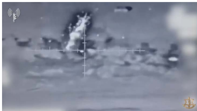
תקיפת חיל הים במרחב זיקים (אתר צה"ל, 8 באוקטובר 2023)

בבוקר 8 באוקטובר 2023 נמשכת הלחימה במספר מוקדים בשטח ישראל בהם עדיין מצויים מחבלים שחלקם אף מחזיקים בבני ערובה (שדרות, כפר עזה, בארי, כיסופים). דובר צה"ל דיווח, כי המשימה של צה"ל ביממה הקרובה היא לפנות את כל יישובי עוטף עזה. במקביל נמשך שיגור הרקטות בעיקר לעבר יישובי עוטף עזה.