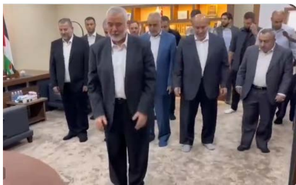
הנהגת חמאס, ובראשה הניה ואלעארורי, חוגגת את המבצע בתפילת תודה לאללה (ערוץ הטלגרם של חמאס, 7 באוקטובר 2023)

◀ אסמאעיל הניה, יו"ר הלשכה המדינית של חמאס , פרסם ממקום מושבו בקטר, הודעה לעיתונות שבה ציין ש"ההתנגדות הפלסטינית" מנהלת מערכה שכותרתה היא מסגד אלאקצא, המקומות הקדושים והאסירים. הוא פירט שהסיבות המרכזיות למערכה הן "התוקפנות הציונית הפושעת" נגד מסגד אלאקצא, שהגיעה לשיאה בימים האחרונים. כוונת ישראל להפגיע אותם ולהסלים את התוקפנות נגד רצועת עזה; המשך התוקפנות הבלתי פוסקת ביהודה ושומרון; פעולות ההרג והרצח בקרב ערביי ישראל; מעצר אסירים פלסטינים במשך עשרות שנים, והתנערות מההסכמות לאחר שישראל עצרה מחדש את משוחררי "עסקת שליט". הוא גם ציין שהמערכה שהחלה ברצועת עזה ותתפשט לשטחי יהודה ושומרון ואף מחוצה להם, לכל מקום בו מצויים פלסטינים. בהמשך נשא הניה נאום שבו אמר כי היו להם ארבעה אסירים, וכי ישראל סירבה להיענות למתווכים לשחררם גם לאחר ש"בהתנגדות" אמרו יותר מפעם אחת שהמחיר יעלה, ועכשיו בידי גדודי אלקסאם ו"ההתנגדות" אסירים רבים (ערוץ הטלגרם של חמאס, 7 באוקטובר 2023).