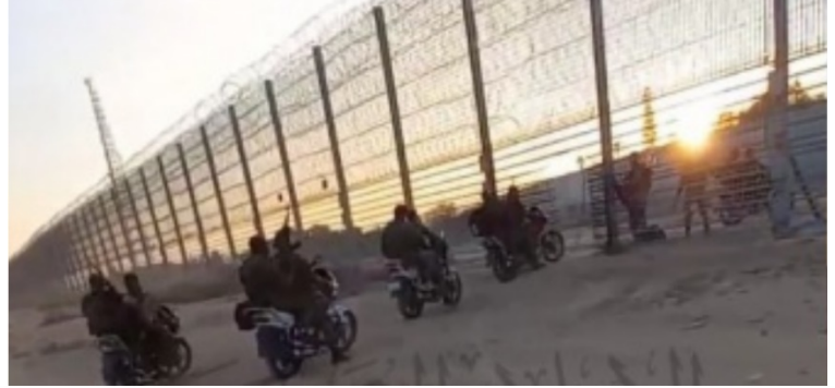
מימין: תיעוד חדירת פעילי חמאס רכובים על גבי אופנועים (מען, 7 באוקטובר 2023). משמאל: פעילים חוצים את גדר הביטחון במזרח ח'אן יונס (חשבון הטוויטר של חסן אצליח, 7 באוקטובר 2023)