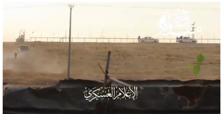
מימין: פעילי הזרוע הצבאית של חמאס חוצים בכלי רכביהם את גדר הביטחון בנחל עוז (חשבון הטוויטר של חסן אצליח, 7 באוקטובר 2023). משמאל: פלסטינים על טנק צה"ל לאחר שהשתלטו עליו (חשבון הטוויטר של שהאב, 7 באוקטובר 2023)

המחבלים חדרו למספר בסיסים ומוצבי צה"ל, ביניהם מפקדת אוגדת עזה, וכן לערים שדרות ואופקים ומספר רב של ישובים בעוטף עזה. בשלב מסוים שלטו פעילי חמאס על יותר מעשרה ישובים במקביל. כמו כן תקפו מחבלים כמה אלפי צעירים שהיו במסיבת טבע באזור. בכל העת המשיכו להגיע מהפרצות שנוצרו בגדר מחבלים לשטח ישראל. המחבלים צרו על הישובים פרצו בתים, הרגו את יושביהם והעלו מבנים באש במספר מקומות התבצרו המחבלים שבידיהם בני ערובה. בכמה ישובים התנהלו קרבות במשך שעות רבות. מחבלים רבים לקחו שבויים אזרחים וחיילים ושבו עמם לרצועה. במהלך היום הצליחו כוחות צה"ל להשתלט על מוקדים רבים בהם היו מחבלים.