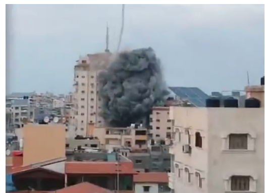
מימין: תקיפת בניין פלסטין בעזה (חשבון הטוויטר של חסן אצליח, 7 באוקטובר 2023). משמאל: תקיפת חיל האוויר במערב העיר עזה (חשבון הטוויטר של שהאב, 7 באוקטובר 2023)

בישראל החליטו לנתק את אספקת החשמל לרצועת עזה. חברת החשמל בעזה הודיעה כי הגרעון באספקת החשמל עומד על 80% בעקבות "תקלה בקווים ישראליים" (מתאם פעולות הממשלה בשטחים, 8 באוקטובר 2023).