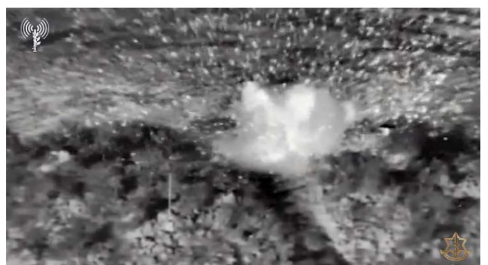
תקיפת צה"ל במרחב הר דב (אתר צה"ל, 8 באוקטובר 2023)