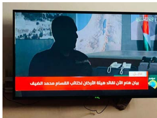
נאום מחמד אלצ'יף (צפא, 7 באוקטובר 2023)

◀ מחמד אלצ'יף, מפקד גדודי עז אלדין אלקסאם, הזרוע הצבאית של חמאס , שהכריז במסר קולי, ששודר בערוץ אלאקצא, על תחילת המבצע, ציין כי במכה הראשונה שוגרו יותר מ-5,000 רקטות ופגזים לעבר ישראל. לדבריו, ישראל תקפה את המראבטאת (שומרי מסגד אלאקצא) וחיללה את מסגד אלאקצא למרות אזהרות שקיבלה בעבר מחמאס. עוד ציין כי בכל יום נמשכות ההפרות בשטחי יהודה ושומרון וכי ישראל ביצעה מאות "מעשי טבח נגד אזרחים". אלצ'יף גם הכריז על סיום התיאום הביטחוני עם ישראל (למרות שהרשות הפלסטינית היא האחראית לכך), וקרא להתגייסות כללית לפלסטינים בירושלים ושל ערביי ישראל כמו גם ל"אחים" בלבנון, בעראק, סוריה ותימן (ערוץ הטלגרם של חמאס, 7 באוקטובר 2023; צפא, 7 באוקטובר 2023).