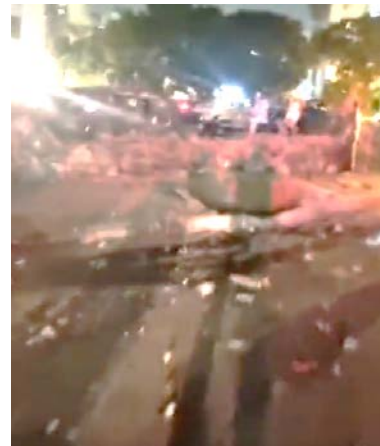
מימין: נפילת רקטה ששוגרה מרצועת עזה בתל אביב. משמאל: פגיעת רקטה ששוגרה מעזה בבניין מגורים באשקלון (חשבון הטוויטר של חסן אצליח, 7 באוקטובר 2023)