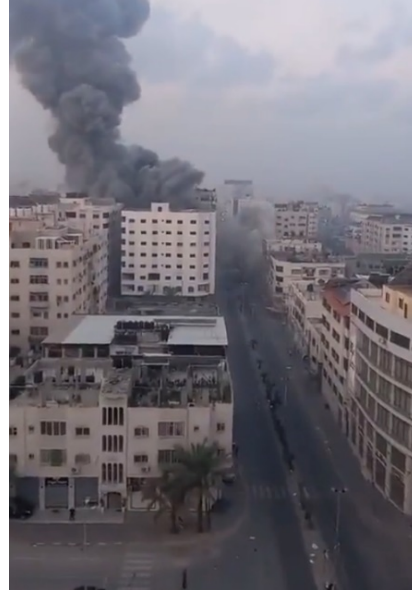
מימין: תקיפת בניין אלעכלוכ בשכונת נצר בעזה (חשבון הטוויטר של שהאב, 8 באוקטובר 2023). משמאל: תקיפת סניף הבנק הלאומי האסלאמי של חמאס בשכונת נצר בעזה (חשבון הטוויטר של שהאב, 8 באוקטובר 2023)