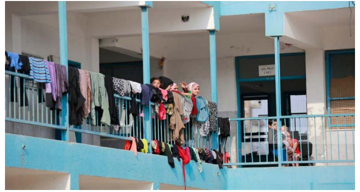
תושבי רצועת מעזה תופסים מחסה בבתי ספר של אונר"א (ופא, 8 באוקטובר 2023)