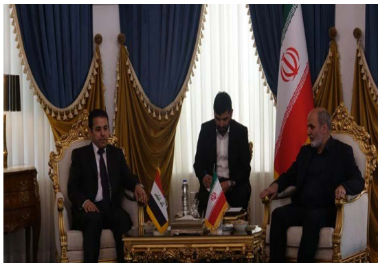
פגישת היועץ לביטחון לאומי של עיראק עם מזכיר המועצה העליונה לביטחון לאומי של איראן (פארס, 1 באוקטובר 2023)

היועץ לביטחון לאומי של עיראק, קאסם אלאערג'י (Qasim al-Araji), הגיע ב-1 באוקטובר 2023 לביקור בטהראן כדי לדון בהשלמת מימוש ההסכם הביטחוני בין שתי המדינות. במסגרת הסכם זה הרחיקה לאחרונה עיראק את הקבוצות הברדלניות הכורדיות, שפעלו בחבל הכורדי בצפון עיראק, מהגבול בין שתי המדינות. זאת, בהתאם לדרישת איראן לפרק קבוצות אלה מנשקן. ב-1 באוקטובר נועד אלאערג'י עם מזכיר המועצה העליונה לביטחון לאומי, עלי-אכבר אחמדיאן (Ali-Akbar Ahmadian), ודן עימו בסוגיות בילטרליות ובהשלמת יישום ההסכם הביטחוני. אחמדיאן הדגיש, כי יש ליישם את ההסכם באופן מדויק ומלא והדגיש את הצורך בקידום הקשרים בין שתי המדינות, לרבות בתחום הכלכלי. אלאערג'י הדגיש את מחויבות ארצו למימוש ההסכם הביטחוני עם איראן ולהרחבת הקשרים בין המדינות (פארס, 1 באוקטובר 2023).