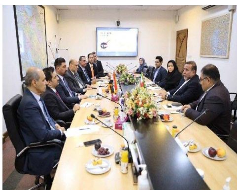
פגישת סגן שר התחבורה האיראני עם סגן שר המסחר העיראקי