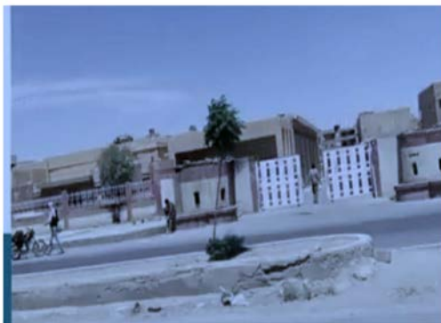
מטה נצר בשימוש משמרות המהפכה בדיר אלזור (עין אלפראת, 5 באוקטובר 2023)