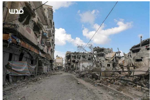
תקיפות בעיר עזה (חשבון הטוויטר של QUDSN, 17 באוקטובר 2023)