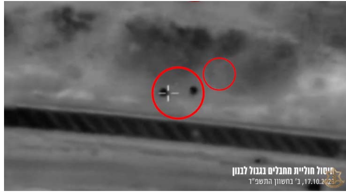
חיסול חוליית המחבלים (אתר צה"ל, 17 באוקטובר 2023)

◀ ב-17 באוקטובר 2023 בסביבות 10:00 שוגר טיל נ"ט לעבר מטולה בגבול לבנון. שלושה בני אדם נפצעו, אחד באורח בינוני ושניים באורח קל. כוחות צה"ל תקפו את האזור ממנו בוצע הירי. ▶ דקות ספורות לאחר מכן ( 10:18), דווח, כי השיגור בוצע על-ידי חזבאללה (ערוץ הטלגרם של אלמיאדין, 17 באוקטובר 2023).