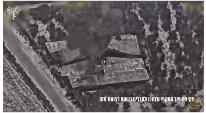
מימין: תקיפת פיר התקפי בו שהו מחבלים. משמאל: פיר ממנו ירו פצצות מרגמה (אתר דובר צה"ל, 16 באוקטובר 2023)