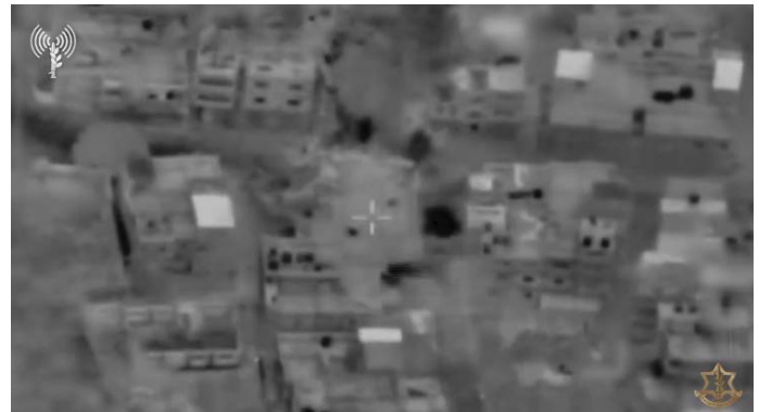
תקיפות חיל האוויר ברצועת עזה (17 באוקטובר 2023)