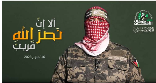
אבו עבידה בנאום. על המסך נכתב: "אכן הנצחון מעם אלוהים קרב ובא" (סורה 2, פסוק 214) (PALINFO, 16 באוקטובר 2023)

חדשה להעניש את ישראל על "הפשעים" שביצעה בימים האחרונים (ערוץ הטלגרם של חמאס, 16 באוקטובר 2023; PALINFO, 16 באוקטובר 2023).