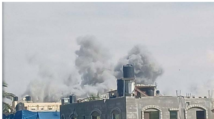
מימין: תקיפת במערב העיר עזה (16 באוקטובר 2023). משמאל: תמונת לוויין המציגה את ההרס בבית חאנון, שבצפון הרצועה 16 באוקטובר 2023