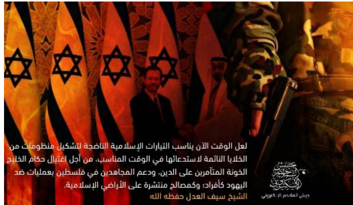
כרזת האיום של אלקאעדה (טלגרם, 17 באוקטובר 2023)