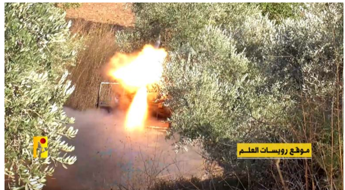
תיעוד שיגור רקטות ופגזים לעבר מוצב גלדולה בהר דב (ערוץ הטלגרם של ההסברה הקרבית, 22 באוקטובר 2023)

כוחות צה"ל המשיכו לתקוף ולהשמיד חוליות בשטח לבנון שתכננו לשגר טילי נ"ט ורקטות לעבר ישראל ולהשמיד את אמצעי הלחימה שברשותן. במהלך היממה האחרונה חוסלו מספר חוליות שתכננו לבצע ירי לעבר מתת, הר דב, מלכיה ושלומי. במקביל, בוצעו תקיפות מהאוויר נגד יעדים צבאיים של חזבאללה ביניהם מתחמים צבאיים ועמדות תצפית (דובר צה"ל, 22, 23 באוקטובר 2023).