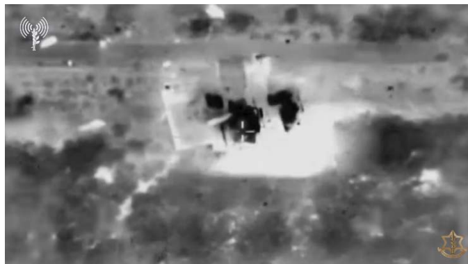
תקיפת תשתית צבאית של חיזבאללה (אתר דובר צה"ל, 23 באוקטובר 2023)

כוחות צה"ל המשיכו לתקוף ולהשמיד חוליות בשטח לבנון שתכננו לשגר טילי נ"ט ורקטות לעבר ישראל ולהשמיד את אמצעי הלחימה שברשותן. במהלך היממה האחרונה חוסלו מספר חוליות שתכננו לבצע ירי לעבר מתת, הר דב, מלכיה ושלומי. במקביל, בוצעו תקיפות מהאוויר נגד יעדים צבאיים של חזבאללה ביניהם מתחמים צבאיים ועמדות תצפית (דובר צה"ל, 22, 23 באוקטובר 2023).