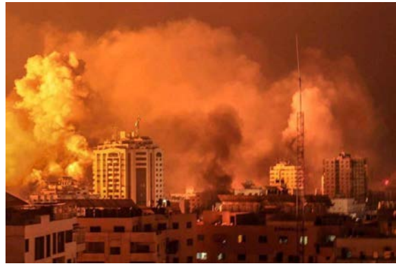
תקיפות ברצועת עזה במהלך הלילה