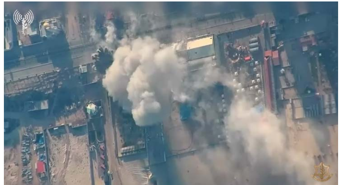
תקיפת תשתיות מבצעיות של חמאס (אתר דובר צה"ל, 23 באוקטובר 2023)