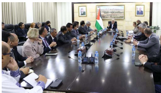
פגישת מחמד אשתיה עם נציגים זרים ברשות (ופא, 22 באוקטובר 2023)

◀ מחמד אשתיה, ראש ממשלת הרשות , נועד בראמאללה עם דיפלומטים מ-25 מדינות. במהלך הפגישה אמר כי התמיכה הבינלאומית "בתוקפנות הישראלית" נחשבת כמתן לגיטימציה להמשך ההרג וההרס וכי יש צורך בחזית בינלאומית אחידה כדי לעצור את תכנית ישראל "לעקור תושבים ולפלוש לרצועה". הוא ציין, כי לצד התוקפנות ברצועה, הם מתמודדים גם עם ה"טרור" מצד צה"ל ביהודה ושומרון, וכי במטרה להמשיך את "רצח" הפלסטינים, כללי הירי שונו וישנן קריאות המעודדות מתנחלים להתחמש (ופא, 22 באוקטובר 2023).