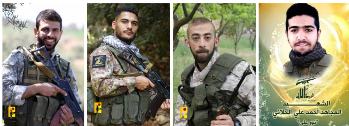
חלק מפעילי חזבאללה שנהרגו ב-22 באוקטובר 2023