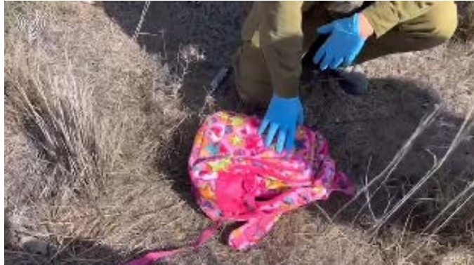
הילקוט הממולכד (חשבון הטוויטר של דובר צה"ל, 22 באוקטובר 2023)

◀ באזור כיסופים, איתרו לוחמים ילקוט בית ספר שהשאירו מחבלי חמאס. בבדיקת התיק נמצא כי הוא היה ממולכד והכיל חומר נפץ להפעלה מרחוק ומטען במשקל של שבעה ק"ג חומר נפץ (דובר צה"ל, 22 באוקטובר 2023). כמו כן נתפס מחבל ששהה בשטח ישראל מאז התקיפה ב-7 באוקטובר 2023.