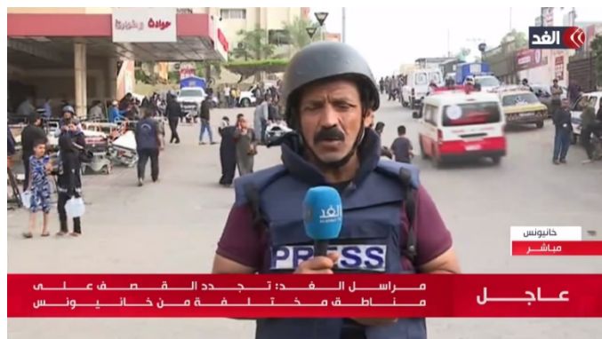
כתב ערוץ אלע'ד מדווח מבית החולים נאצר בח'אן יונס (ערוץ אלע'ד, 23 באוקטובר 2023)