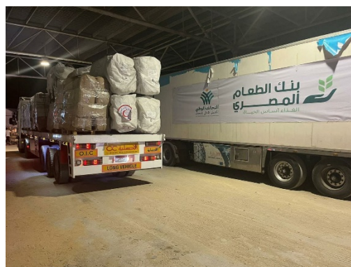
מימין: הכנסת סיוע הומניטארי לעזה דרך מעבר רפיח (חשבון הטוויטר של חסן אצליח, 22 באוקטובר 2023). משמאל: נציג או"ם מפקח על הכנסת הסיוע ההומניטארי (דף הפייסבוק של חדשות מעבר רפיח, 22 באוקטובר 2023)