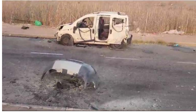
נפילת רקטה סמוך לכלי רכב בנתיבות (22 באוקטובר 2023)

◀ סה"כ שוגרו לשטח ישראל מתחילת המלחמה למעלה מ-7,500 רקטות. כמה מאות רקטות נפלו בשטח הרצועה.