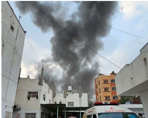
מימין: תקיפת בית סמוך לבית החולים כמאל עדואן בבית לאהיא (חשבון הטוויטר של שהאב, 23 באוקטובר 2023). משמאל: תקיפת בניין ריאן במחנה הפליטים ג'באליא (חשבון הטוויטר של QUDSN, 23 באוקטובר 2023)

◀ פעילות קרקעית: כוחות צה"ל, בליווי טנקים וכלים הנדסיים, פעלו באזור כיסופים על גבול רצועת עזה. מטרות הפעילות היו סיכול טרור, טיהור המרחב ממחבלים כהכנה לקראת תמרון קרקעי, וניסיון לאיסוף מידע נוסף בנוגע לנעדרים ולחטופים. במהלך אחת הפשיטות בוצע ירי טיל נ"ט מהרצועה לעבר טנק וכלי הנדסי של צה"ל. לוחם צה"ל נהרג ושלושה לוחמים נפצעו (דובר צה"ל, 22 באוקטובר 2023). בליל 22-23 באוקטובר נערכה פעילות משותפת של כוחות חי"ר במסגרתה תקפו הכוחות מספר מטרות ביניהן חוליות מחבלים ובהן חוליות נ"ט (דובר צה"ל, 23 באוקטובר 2023).