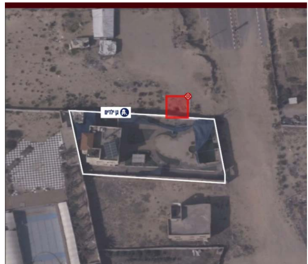
שיגורים מקרב אוכלוסייה אזרחית. מימין: נקודת שיגור סמוך לגן ילדים. משמאל: נקודת שיגור סמוך למבנה של האו"ם (דובר צה"ל, 22 באוקטובר 2023)