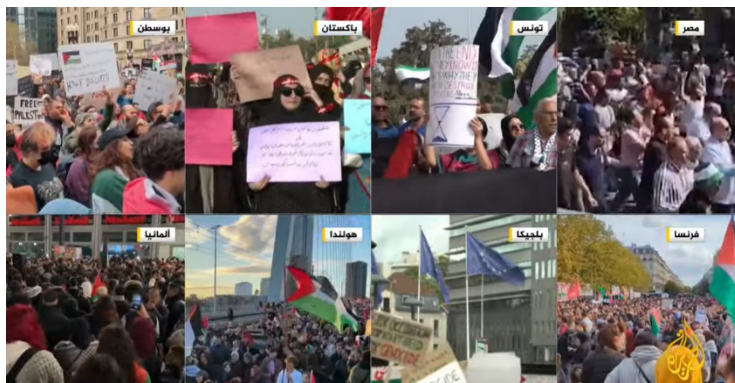
הפגנות התמיכה בפלסטינים בבוסטון, פקיסטאן, תוניסיה, מצרים, צרפת (פריז), בלגיה (בריסל), הולנד וגרמניה (אלג'זירה, 22 באוקטובר 2023)