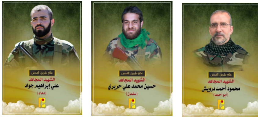
הרוגי חזבאללה ב-25 וב-26 אוקטובר 2023 (ערוץ הטלגרם של זרוע ההסברה הקרבית, 25-26 באוקטובר 2023)

◀ ב-25 באוקטובר 2023 פרסם חזבאללה סרטון, בו מתועדים תמונותיהם ושמותיהם של 44 פעילי הארגון, שנהרגו באירועים בגבול לבנון. 42 מההרוגים המתועדים הם פעילי חזבאללה ושניים, פעילי ארגון הפלוגות הלבנוניות להתנגדות לכיבוש הישראלי, המזוהה עם חזבאללה ואשר פועל לצדו. כמו כן ידוע על לפחות שבעה פעילים פלסטינים שנהרגו: ארבעה פעילי הג'האד האסלאמי בפלסטין (שנים מסוריה ושניים מדרום לבנון), ושלושה פעילי חמאס. נכון ל-16 באוקטובר 2023, מניין ההרוגים הכולל של ארגוני הטרור בגבול לבנון הינו לפחות 53 פעילים.