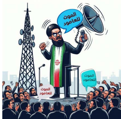
קריקטורה המותחת ביקורת על חזבאללה (חשבון הטוויטר @Bilal_aljaber18, 25 באוקטובר 2023)

נראה קהל החוזר על קריאותיו וברקע מגדל תקשורת של צה"ל באחד מהמוצבים בגבול לבנון המהווים יעד לתקיפות חזבאללה (חשבון הטוויטר @Bilal_aljaber18, 25 באוקטובר 2023).