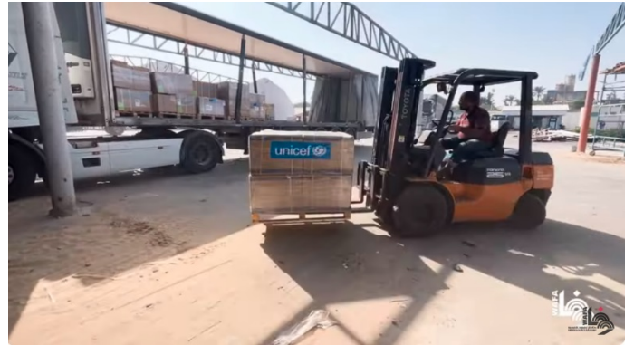
תיעוד המחסן הלוגיסטי של אונר"א בדיר אלבלח והעמסתו על משאיות ציוד רפואי (ערוץ היוטיוב של ופא, 25 באוקטובר 2023)