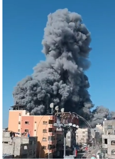
מימין: תקיפה במערב ח'אן יונס. משמאל: תוצאות תקיפה ברפיח