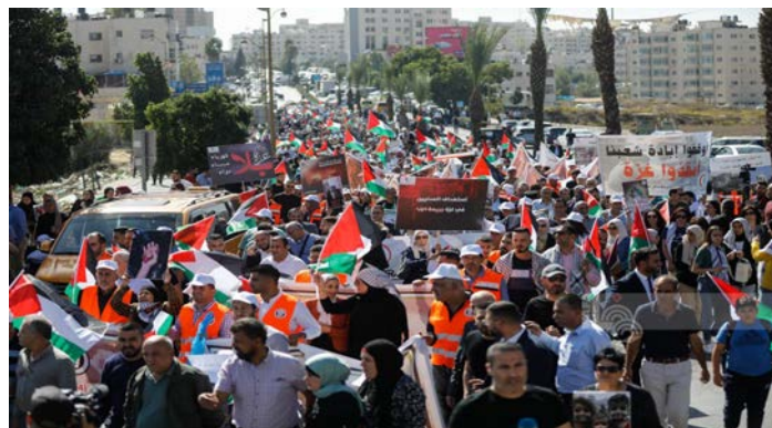
מימין: פעילות באלבירה; משמאל: פעילות מחאה ביעבד (פאלטודיי, 25 באוקטובר 2023)