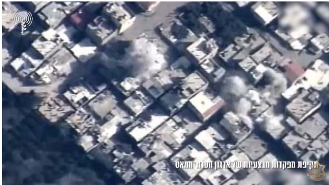
תקיפת מפקדות מבצעיות של ארגון הטרור חמאס