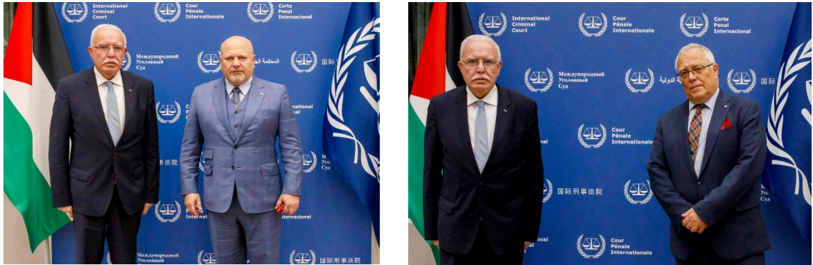
פגישת שר החוץ בכירי ה-ICC, ראש בית הדין (מימין) והתובע הכללי כרים ח'אן (משמאל)

הדין הבינלאומי, 25 באוקטובר 2023). בפגישות, ביקש אלמאליכי מהמוסדות הבינלאומיים לנקוט בצעדים מהירים ש"יביאו להפסקת התוקפנות". כמו כן, הוא הדגיש את הצורך שבית הדין ישלים את חקירתו הפלילית ויעמיד לדין את "פושעי המלחמה הישראלים" (ערוץ הטלגרם של משרד החוץ של הרשות הפלסטינית, 25 באוקטובר 2023).