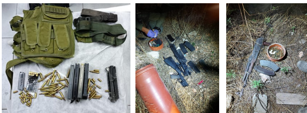
אמצעי הלחימה שהוחרמו בפעילות הכוחות (אתר צה"ל, 25 באוקטובר 2023)

◀ ב-25 באוקטובר 2023, בשעות הלילה, פעלו כוחות ביטחון ישראליים לסיכול טרור ברחבי יהודה ושומרון. במהלך המבצע עצרו הכוחות 68 מבוקשים החשודים במעורבות בפעילות טרור, מהם 58 פעילי חמאס. בין העצורים שני פעילי חמאס בכירים . מאז תחילת המלחמה בעזה נעצרו כ-1,000 מבוקשים מהם 660 פעילי חמאס (דובר צה"ל, 26 באוקטובר 2023). משרד הבריאות ברשות הפלסטינית דיווח על 102 הרוגים ביהודה ושומרון מאז תחילת המלחמה בעזה (דף הפייסבוק של משרד הבריאות הפלסטיני, 25 באוקטובר 2023).