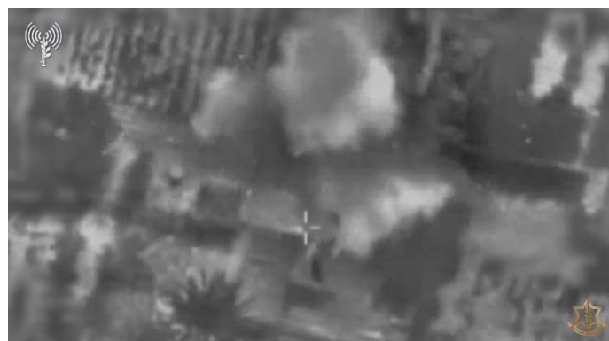
תקיפת לאחר שיגור רקטות מסביבה אזרחית (אתר צה"ל, 26 באוקטובר 2023)