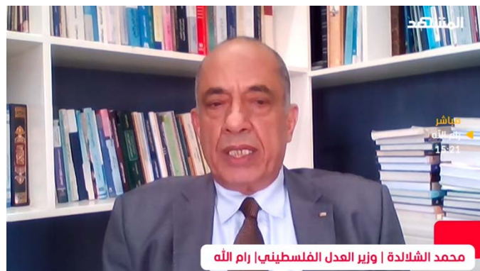
מחמד שלאידה בראיון לערוץ אלמשהד (ערוץ אלמשהד, 25 באוקטובר 2023)

◀ בעת ביקורו הגיש אלמאליכי לבית הדין הבינלאומי לצדק (ICJ) מסמך שני "בנוגע לכיבוש", והדגיש את חשיבות ההליך המשפטי, במיוחד בנסיבות אלו שבהן ישראל "מפרה את החוק הבינלאומי". לדברי אלמאליכי, על פי תזכיר שקיבלה הרשות מבית המשפט, שלב הטיעונים אמור להתחיל ב-19 בפברואר 2024. לדבריו, נציגי הרשות יופיעו בפני בית המשפט בתאריך הנקוב (ערוץ הטלגרם של משרד החוץ ברשות, 25 באוקטובר 2023). ◀ מחמד שלאידה, שר המשפטים ברשות הפלסטינית , אמר בראיון, כי ישראל מפרה הסכמים והחלטות בינלאומיות בנושא זכויות אדם. לדבריו, ישראל מטילה מצור על עזה, גורמת לעקירת תושבים מבתיה ומשתמשת במהלך המלחמה בעזה בנשק אסור לשימוש. בנוסף, הוא האשים את ארה"ב בתמיכה שהיא מעניקה לישראל ובזכות הווטו שהיא מטילה במועצת הביטחון של האו"ם. הוא קרא לאו"ם לסלק את ישראל משורותיו בשל פעולותיה נגד הפלסטינים (ערוץ אלמשהד, 25 באוקטובר 2023).