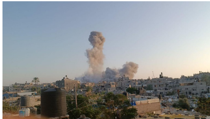
תקיפת חיל האוויר באלבריג', במרכז הרצועה (חשבון הטוויטר של שהאב, 25 באוקטובר 2023)

◀ פעילות קרקעית: בליל 25-26 באוקטובר 2023, כחלק מההכנות לשלבי הלחימה הבאים, ביצעו כוחות צה"ל פשיטה ממוקדת באמצעות טנקים בצפון רצועת עזה. הכוחות איתרו ותקפו מחבלים רבים, השמידו תשתיות טרור, עמדות נ"ט וביצעו עבודות להכנת המרחב. לאחר סיום המשימה, יצאו הכוחות מהשטח (דובר צה"ל, 26 באוקטובר 2023).