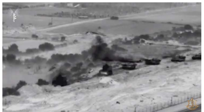
פעילות קרקעית בצפון הרצועה