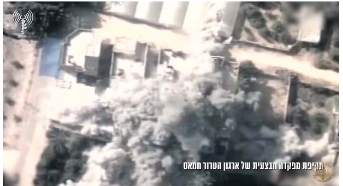
תקיפת מפקדה מבצעית של ארגון הטרור חמאס