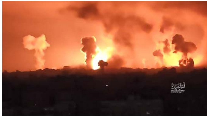
מימין: תקיפות חיל האוויר בשעות הלילה (חשבון הטוויטר של חסן אצליח, 27 באוקטובר 2023). משמאל: תקיפות חיל האוויר בבית לאהיא (חשבון הטוויטר של QUDSN, 27 באוקטובר 2023)

◀ פעילות קרקעית: במקביל לתקיפות האוויריות החלו צוותי קרב משולבים של כוחות שריון, הנדסה וחי"ר, בליווי כלי טיס בלתי מאוישים, ומסוקי קרב להרחיב בהדרגה את הפעילות הקרקעית בעיקר בצפון רצות עזה, אזור שפונה מתושבים. במהלך הפעילות הותקפו עשרות מטרות חמאס ביניהן עמדות שיגור טילי נ"ט וחוליות שיגור, מפקדות מבצעיות. (דובר צה"ל, 26-28 באוקטובר 2023).