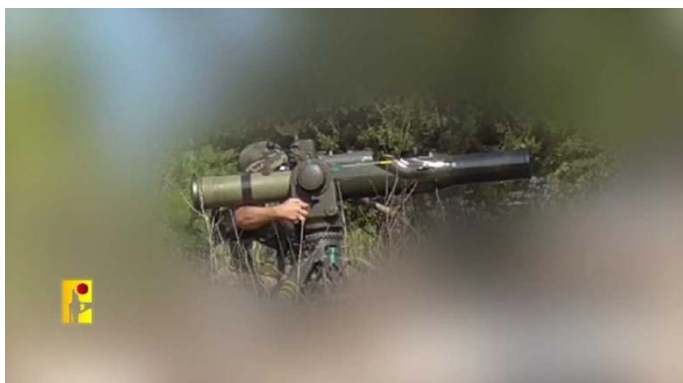
תיעוד שיגור טיל לעבר מוצב ציפורן (ערוץ הטלגרם של זרוע ההסברה הקרבית, 29 באוקטובר 2023)