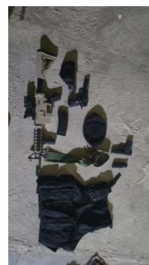
אמצעי הלחימה שהוחרמו במהלך פעילות כוחות הביטחון (אתר דובר צה"ל, 29 באוקטובר 2023)