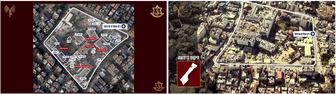
מימין: בית החולים, משמאל: תיאור מפקדת החמאס מתחת לבית החולים (אתר צה"ל, 27 באוקטובר 2023)

◀ בחמאס הגיבו לטענת דובר צה"ל וציינו כי אלה הן טענות שווא וכי דבריו סוללים את הדרך לפגיעה בבית החולים המרכזי, שבו נמצאים אלפי פצועים, חולים ועקורים (ערוץ הטלגרם של חמאס, 27 באוקטובר 2023). עזת אלרשק, חבר הלשכה המדינית של חמאס , ציין כי אין בסיס לטענות בנוגע לנוכחות הנהגת חמאס מתחת לבית החולים וכי "שקרים אלו" מהווים הקדמה לביצוע "טבח חדש נגד הפלסטינים, שיהיה גדול יותר מהטבח שבוצע בבית החולים אלמעמדאני" 3 . חמאס קראה לאו"ם ולמדינות האסלאם "להתערב מיד ולעצור את השמדת מערכת הרפואה" (ערוץ הטלגרם של אלרשק, 27 באוקטובר 2023). ◀ במסיבת עיתונאים שערך בבירות ע'אזי חמד, חבר הלשכה המדינית של חמאס , הוא הכחיש את הצהרת דובר צה"ל וציין, כי כל הטענות הללו הינן חסרות בסיס, אין להן הוכחות והן חלק מתעמולה ישראלית שנועדה להצדיק ביצוע מעשי טבח נוספים ולגרום לבית החולים להפסיק לפעול (אלג'זירה, 28 באוקטובר 2023). ◀ עבד אללטיף אלקאנוע דובר חמאס , ציין שמטרת ההאשמות הללו היא לאיים על בתי החולים לקראת תקיפתם, כפי שישראל עשתה עם בית החולים אלמעמדאני וכנסיית פורפיריוס הקדוש (אתר ערוץ אלג'זירה, 27 באוקטובר 2023).