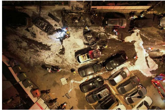
מימין: פגיעה ישירה של רקטה מעזה בקריית אוננו. משמאל: פגיעה ישירה של רקטה מעזה בבניין מגורים בתל אביב