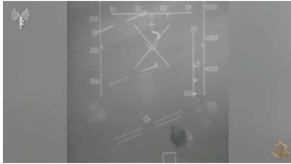
סיכול האיום