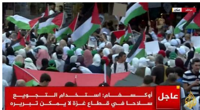
הפגנה בעמאן (אלג'זירה, 27 באוקטובר 2023)

◀ אימן אלצפדי, שר החוץ הירדני , נועד בניו יורק עם מקבילו האיראני, חסין אמיר עבדאללהיאן, ודן עימו במאמצים לעצור את הלחימה ברצועה ולהעביר אליה סיוע הומניטרי. השניים גם דנו בסכנה שצפויה לכל האזור אם תורחב הלחימה. אלצפדי הדגיש כי כל המאמצים חייבים להיות למען עצירת המלחמה ולמען ביטחון האזרחים (פטרה, 26 באוקטובר 2023).