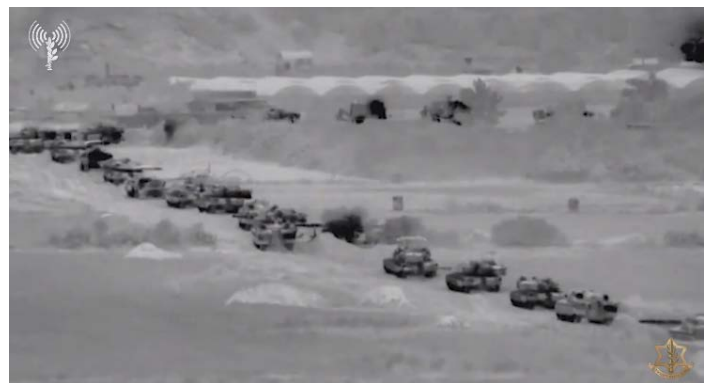
פעילות כוחות קרקעיים ברצועת עזה