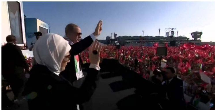
הפגנת תמיכה בפלסטינים בחסות הנשיא ארדואן (JustAsitis, 28 באוקטובר 2023)

◀ נשיא תורכיה רג'פ טייפ ארדואן פרסם בחשבון הטוויטר שלו כרזה הקוראת להשתתף בהפגנה ב-28 באוקטובר 2023 בנמל התעופה איסטנבול-אטאטורק לתמיכה בפלסטינים (חשבון הטוויטר של ארדואן, 28 באוקטובר 2023). בנאום שנשא בהפגנה, הוא גינה את "פשעי המלחמה שישראל מבצעת ברצועת עזה". הוא ציין כי הם ידעו שישראל תתעצבן כאשר הוא אמר שחמאס אינה ארגון טרור, אבל למרות זאת הם הביעו את עמדתם. עוד ציין בנאומו כי הם נערכים להכריז בפני כל העולם שישראל היא "פושעת מלחמה" (אנטוליה, 28 באוקטובר 2023).