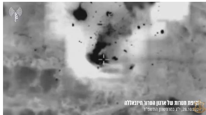
תקיפת מטרת חזבאללה בלבנון (אתר דובר צה"ל, 28,29 באוקטובר 2023)