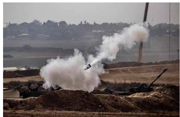
ירי ארטילרי לעבר בית חאנון, בצפון הרצועה (חשבון הטוויטר של QUDSN, 28 באוקטובר 2023)

◀ פעילות ימית: כוחות זרוע הים תקפו במקביל מטרות המשמשות את חמאס, ביניהן עמדות תצפית, עמדות שיגורי נ"ט ומתקנים צבאיים וסייעו לכוחות היבשה (דובר צה"ל, 28 באוקטובר 2023). בליל 26-27 באוקטובר 2023 לוחמי הקומנדו הימי וכוחות ימיים נוספים, ביצעו פשיטה ממוקדת בדרום רצועת עזה. הכוחות השמידו תשתיות טרור של חמאס ופעלו במתחם המשמש את כוחות הקומנדו הימי של הארגון.