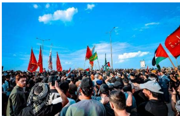
הפגנת תמיכה בפלסטינים בעיראק על גבול ירדן (אלסומריה, 27 באוקטובר 2023)

◀ מקתדא אלצדר, יו"ר זרם אלצדר בעיראק ומנהיג הזרם השיעי המתנגד לנוכחות איראן במדינה, פרסם הודעה בה קרא לממשלת עיראק ולפרלמנט העיראקי לסגור את השגרירות האמריקנית בעיראק בשל תמיכתה של ארה"ב בפעילות ישראל נגד רצועת עזה. זאת, תוך מחויבות להגן על הצוות הדיפלומטי האמריקני מתקיפת מיליציות אשר מעוניינות לערער את ביטחונה של עיראק (חשבון הטוויטר של צדר, 27 באוקטובר 2023).