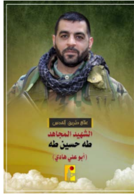
הרוג חזבאללה ב-26 אוקטובר 2023