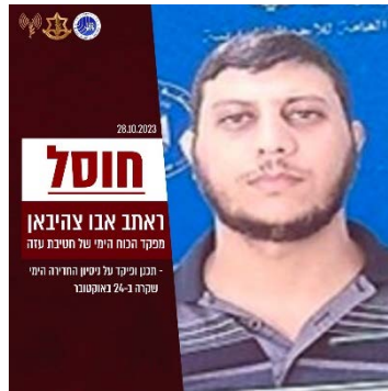
ראתב אבו צהיבאן (חשבון הטוויטר של צה"ל, 28 באוקטובר 2023)

◆ ראתב אבו צהיבאן , מפקד הכוח הימי של חטיבת עזה. צהיבאן תכנן ופיקד על ניסיון החדירה הימי ב-24 באוקטובר 2023 בחוף זיקים (חשבון הטוויטר של צה"ל, 28 באוקטובר 2023). גולש, שציטט את הודעת דובר צה"ל כתב: "נהרג המפקד ראתב אבו צהיבאן אלטרובין" (דף הפייסבוק של אבו מצעב אלטרובין, 28 באוקטובר 2023).