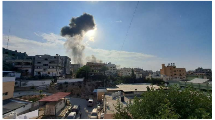
תקיפת חיל האוויר בג'באליא (חשבון הטוויטר של שהאב, 31 באוקטובר 2023)