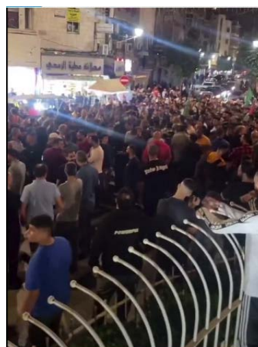
מימין: פעילות ברמאללה (חשבון הטוויטר של אתר אלקסטל, 31 באוקטובר 2023). משמאל: בכיר חמאס, השיח' ג'מאל אלטויל, נואם ברמאללה (חשבון הטוויטר QUDSN, 31 באוקטובר 2023)