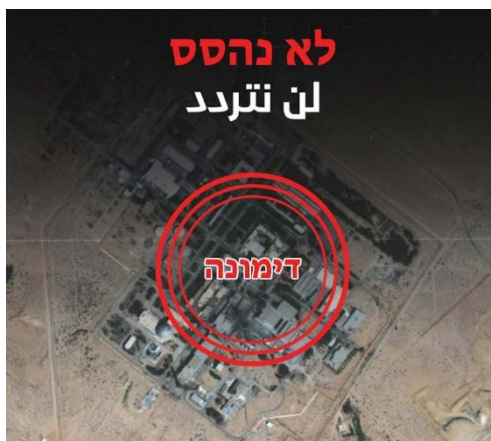
הכרזה המאיימת לפגוע בדימונה (חשבון הטוויטר איראן באלערביה, 31 באוקטובר 2023)

◀ לשכת ההסברה של התנועה החות'ית (אנצאר אללה) פרסמה כרזה בעברית ובערבית המאיימת לפגוע בדימונה תחת הכיתוב "לא נהסס" (חשבון הטוויטר איראן באלערביה, 31 באוקטובר 2023).