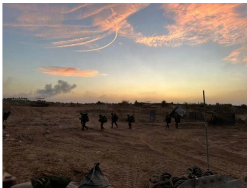
הפעילות הקרקעית של צה"ל ברצועת עזה (אתר דובר צה"ל, 1 בנובמבר 2023)