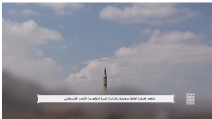
טיל בליסטי ששוגר לעבר ישראל (ערוץ הטלגרם של ההסברה הקרבית של החות'ים, 1 בנובמבר 2023)

◀ לפני התקיפה האחרונה, הודיע יחיא סריע , דובר הכוחות המזוינים של החות'ים , כי הם שיגרו מספר רב של טילים בליסטיים וטילי שיוט ומספר רב של כלי טיס בלתי מאוישים לעבר מטרות בישראל. הוא אישר כי מדובר ב"פעולה השלישית לתמיכה באחינו המדוכאים בשטחים הפלסטיניים". הוא גם הזהיר שהכוחות ימשיכו לבצע תקיפות "איכותיות" (רשת אלמסירה, 31 באוקטובר 2023).