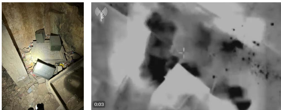
מימין: תקיפת כלי טיס. משמאל: המטענים שאותרו (אתר דובר צה"ל, 1 בנובמבר 2023)