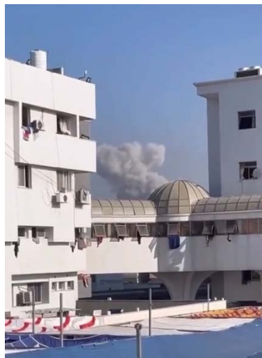
תקיפת חיל האוויר בשעות הבוקר סמוך לבית החולים אלשפאא' בעזה (חשבון הטוויטר של QUDSN, 1 בנובמבר 2023)