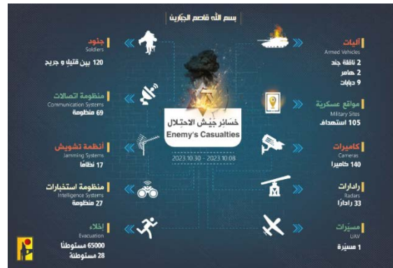
האינפוגרף שפרסם חזבאללה המסכם את פעילות הארגון (ערץ הטלגרם של זרוע ההסברה הקרבית של חזבאללה, 31 באוקטובר 2023)