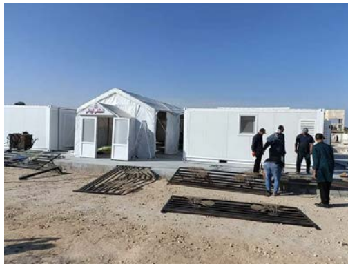
הקמת בית חולים שדה באלשיח' זויד (דף הפייסבוק של חדשות מעבר רפיח, 31 באוקטובר 2023)

◀ במקביל, נמשכות ההכנות במצרים להקמת בית חולים שדה באלשיח' זויד סמוך לרפיח המצרית, כדי לקלוט פצועים פלסטינים מהרצועה (דף הפייסבוק של חדשות מעבר רפיח, 31 באוקטובר 2023).