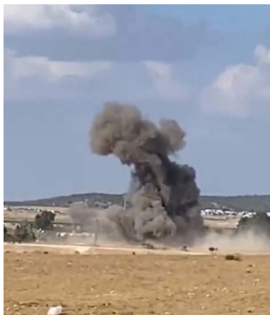
נפילת רקטה מזרחית לבאר שבע

◀ סה"כ שוגרו מאז תחילת המלחמה למעלה מ-8,500 רקטות ופצצות מרגמה לעבר ישראל. כ-10% מהם היו שיגורים כושלים שנפלו בשטח הרצועה ובים.