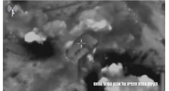
תקיפות צה"ל ברצועת עזה (אתר דובר צה"ל, 1 בנובמבר 2023)