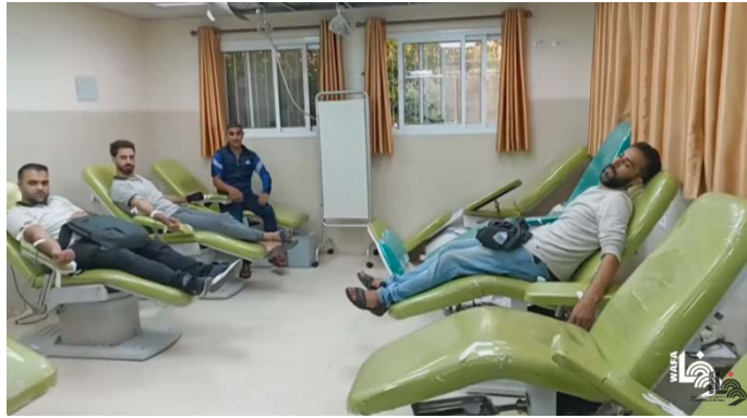
תושבים תורמים דם בבית החולים אלשפא' בעזה (ערוץ הייטיב של ופא, 1 בנובמבר 2023)

◀ במקביל, נמשכות ההכנות במצרים להקמת בית חולים שדה באלשיח' זויד סמוך לרפיח המצרית, כדי לקלוט פצועים פלסטינים מהרצועה (דף הפייסבוק של חדשות מעבר רפיח, 31 באוקטובר 2023).