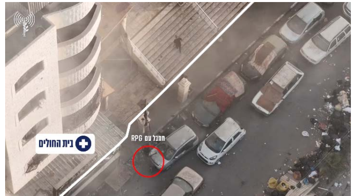
מימין: מחבל סמוך לבית החולים. משמאל: טנק צה"ל שבוצע לעברו ירי מבית החולים (אתר דובר צה"ל, 13 בנובמבר 2023)

◀ במהלך הפעילות הקרקעית נחשף פיר מנהרה הממוקם במסגד (דובר צה"ל, 14 בנובמבר 2023). ב-14 בנובמבר 2023, בשעות הבוקר, פשטו כוחות צה"ל על מפקדתו של איימן נופל, מפקד חטיבה בחמאס שנהרג בתקיפות צה"ל ברצועה לפני מספר ימים (אתר צה"ל, 14 בנובמבר 2023).