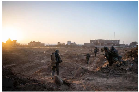
פעילות כוחות צה"ל ברצועת עזה (אתר דובר צה"ל, 14 בנובמבר 2023)