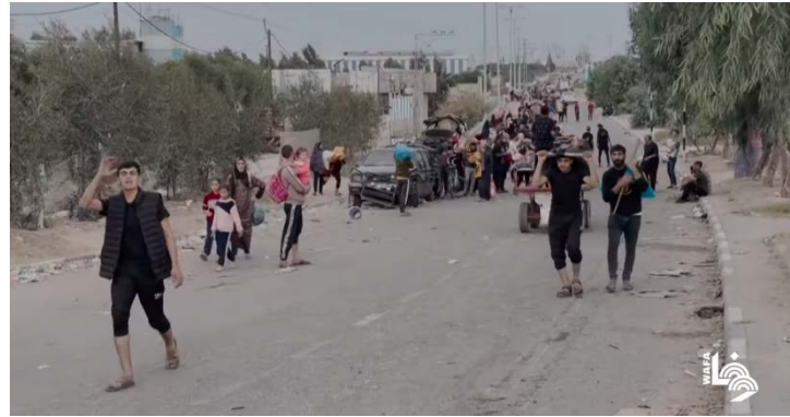
תושבי צפון הרצועה ממשיכים להתפנות דרומה (ערוץ היוטיוב של ופא, 13 בנובמבר 2023)