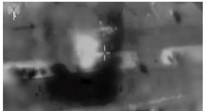
תקיפת מטרות ברצועת עזה (אתר דובר צה"ל, 14 בנובמבר 2023)