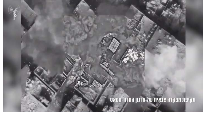
תקיפת מפקדה צבאית של ארגון הטרור חמאס