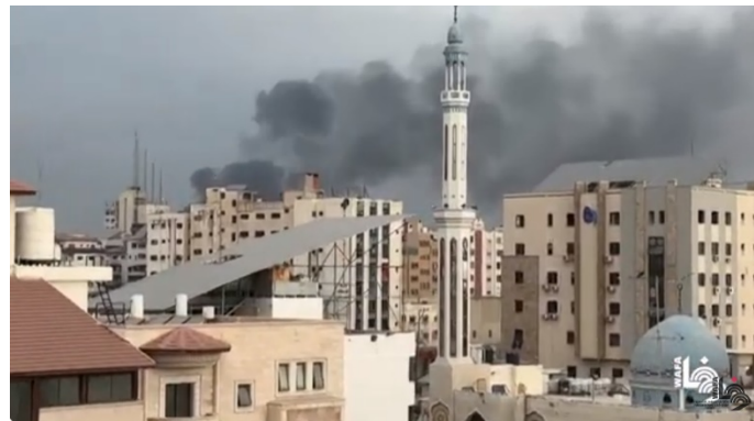
תקיפות חיל האוויר בשעות הבוקר בעזה (ערוץ היוטיוב של ופא, 14 בנובמבר 2023)

◀ פעילות ימית: כוחות זרוע הים תקפו מחנה צבאי ששימש את המערך הימי של חמאס, למטרות אימונים ולאחסון אמצעי לחימה (דובר צה"ל, 14 בנובמבר 2023).