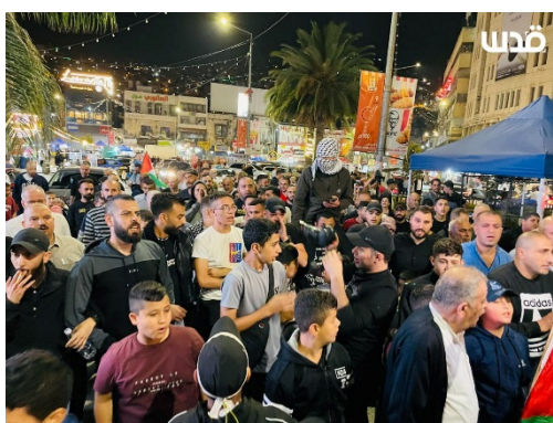
הפגנה בשכם במחאה על המלחמה ברצועת עזה (ערוץ הטלגרם של QUDSN, 13 בנובמבר 2023)