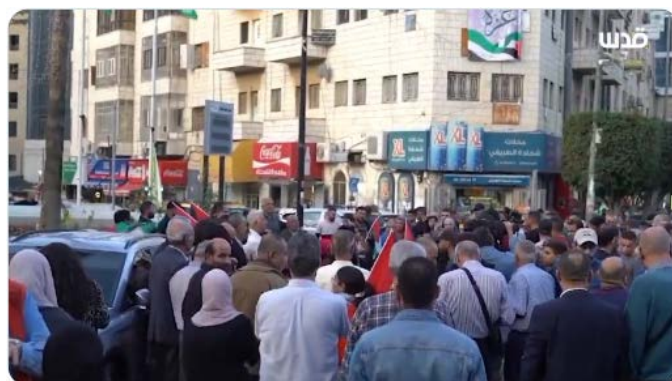
הפגנה בראמאללה בדרישה להחרים מוצרים ישראליים, בהשתתפות בכיר פתח צברי צידם (חשבון X של QUDSN, 13 בנובמבר 2023)