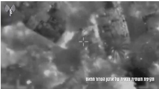
תקיפת תשתית צבאית של ארגון הטרור חמאס