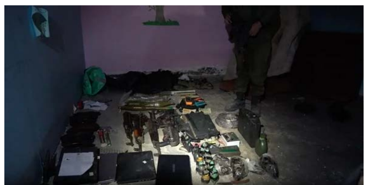
מימין: אמצעי לחימה שאותרו במרתף בית החולים. משמאל: מנהרה סמויה מבית בכיר חמאס המובילה לבית החולים (אתר דובר צה"ל, 13 בנובמבר 2023)