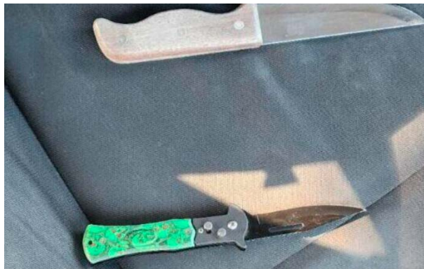
הסכינים שנמצאו ברשות שני הנערים (דוברות המשטרה, 13 בנובמבר 2023)

ב-2 בנובמבר 2023 סוכל פיגוע דקירה סמוך לתחנת הרכבת סבידור בתל אביב. שני נערים בני 14, תלמידי בית ספר מאם אלפחם נעצרו ע"י שוטרים לאחר שעוררו את חשדם. בחיפוש על גופם נמצאו שתי סכינים. מחקירתם עלה, כי הם יצאו מביתם עם תיקי בית ספר בבוקר האירוע ועלו על אוטובוס לכיוון תל אביב, במטרה לבצע פיגוע דקירה נגד חיילים. השניים ירדו מהאוטובוס באזור דרך נמיר, הניחו את תיקי בית הספר בצד והחביאו את הסכינים על גופם (דוברות המשטרה, תקשורת ישראלית, 13 בנובמבר 2023).