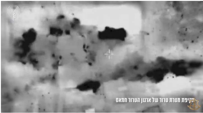
תקיפת מטרת טרור של ארגון הטרור חמאס (אתר דובר צה"ל, 13 בנובמבר 2023)