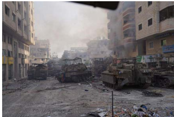
כלים משוריינים של צה"ל בעזה (חשבון X של QUDSN, 13 בנובמבר 2023)

◀ פעילות אווירית: כלי טיס של חיל האוויר תקפו ביממה האחרונה כמאתיים מטרות חמאס ביניהן פעילים, אתרי ייצור אמצעי לחימה, עמדות שיגור טילי נ"ט ומפקדות צבאיות (דובר צה"ל, 14 בנובמבר 2023). בסיכול ממוקד מהאוויר נהרגו מספר פעילי חמאס ביניהם: יעקוב עאשור, אחראי מערך הנ"ט בחטיבת ח'אן יונס; מחמד חמיס דבאבש, ששימש כראש המודיעין הצבאי של חמאס ובשנתיים האחרונות שימש כמזכירו של אחראי תיק היחסים הבינלאומיים בלשכה המדינית; תחסין מסלם, מפקד פלוגת הסיוע הקרבי שהיה אחראי על הכוחות המיוחדים בבית לאהיא; ג'אהד עזאם, קצין חקירות של המודיעין הצבאי בזיתון ומניר חרב, ראש מערך ההסברה בחטיבת רפיח (דובר צה"ל, 13 בנובמבר 2023).