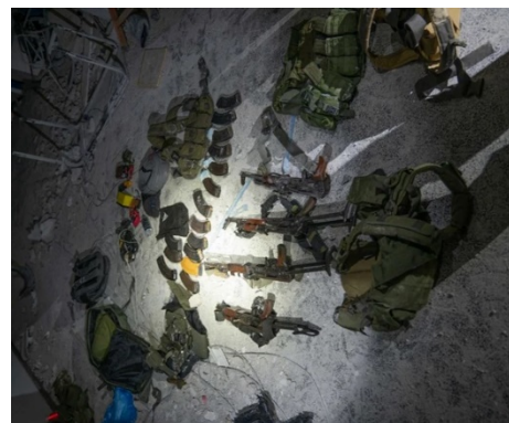
אמצעי הלחימה שאותרו במחנה של המערך הימי של חמאס (אתר דובר צה"ל, 14 בנובמבר 2023)